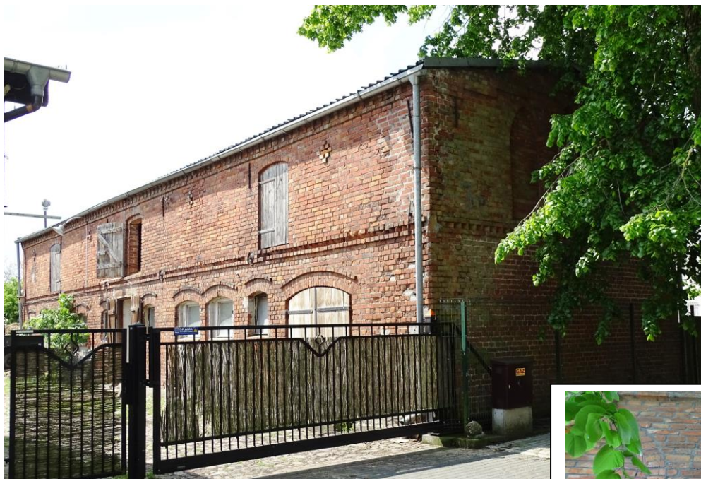
Widok ogólny od pñ.-wschodu

8. Fotografia z opisem wskazującym orientację albo mapa z zaznaczonym stanowiskiem archeologicznym