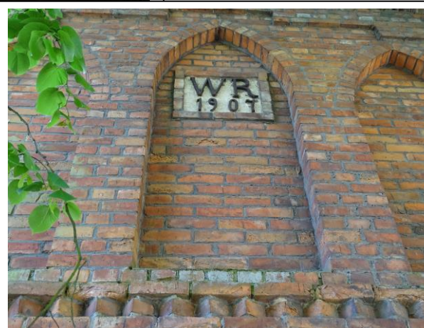
Detal i datownik w szczycie północnym