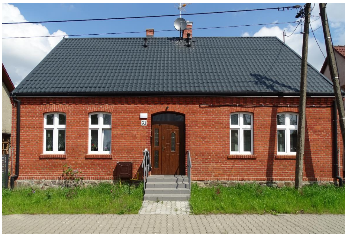
Elewacja frontowa - południowa

8. Fotografia z opisem wskazującym orientację albo mapa z zaznaczonym stanowiskiem archeologicznym