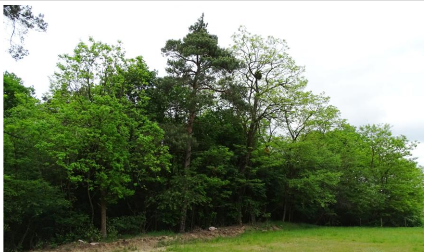
Widok ogólny od południa

8. Fotografia z opisem wskazującym orientację albo mapa z zaznaczonym stanowiskiem archeologicznym