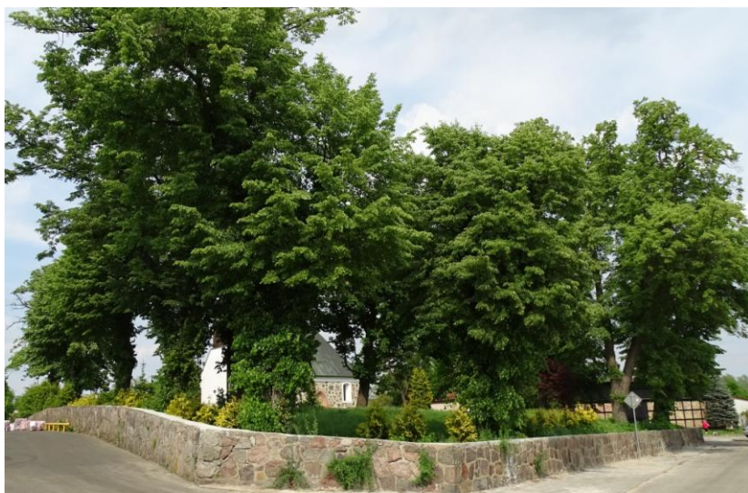
Widok ogólny południa

8. Fotografia z opisem wskazującym orientację albo mapa z zaznaczonym stanowiskiem archeologicznym