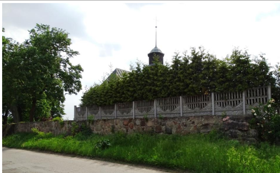
Północna część d. cmentarza

Cmentarz przykościelny założony został w średniowieczu, równocześnie z budową świątyni; obecnie częściowo przekształcony. Cmentarz o nieregularnym (wielobocznym) rozplanowaniu między trzema drogami wiejskimi, wygrodzony murem kamiennym, bramą od wschodu (ceglane filary) i furtką od zachodu. Północna część cmentarza wtórnie podzielona (płotem betonowym) i włączona do sąsiedniej posesji. Zatarty układ kwater i brak widocznych śladów sepulkralnych. Obrzeża cmentarza obsadzone zwartymi rzędami lip i klonów; oprócz tego rosną kasztanowce. Teren trawiasty, przedzielony – na osi wejść – chodnikiem z polbruku.