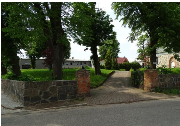
Widok ogólny od pld.-wschodu