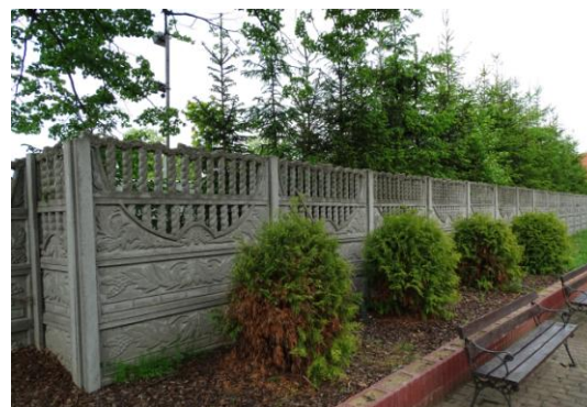
Północna część d. cmentarza