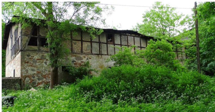
Widok ogólny od południa