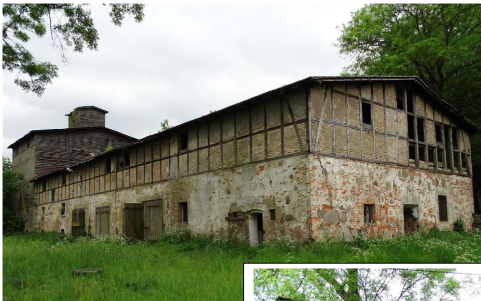
Widok ogólny od północy

8. Fotografia z opisem wskazującym orientację albo mapa z zaznaczonym stanowiskiem archeologicznym