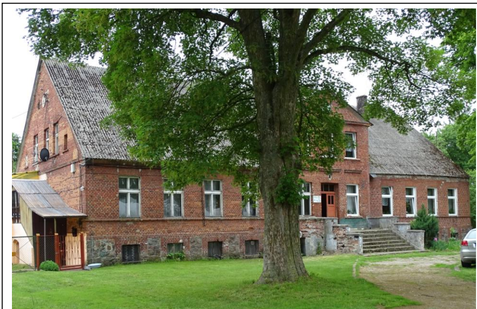
Widok ogólny od pñ.-wschodu

Dawny dom zarządcy miejscowego majątku; obecnie budynek wielorodzinny. Budynek założony na planie wydłużonego prostokąta, parterowy, podpiwniczony, nakryty wysokim dachem dwuspadowym z mieszkalnym poddaszem. Ściany murowane z cegły ceramicznej (nietynkowane), osadzone na kamiennym cokole. Elewacje o pierwotnej kompozycji i wystroju, z użyciem elementów detalu architektonicznego (gzymsy). Fasada 11-osiowa, zaakcentowana 3-osiowym 2-kondygnacyjnym ryzalitem pozornym, zwieńczonym trójkątnym szczytem. Stolarka okienna i drzwiowa w większości wtórna, ale osadzona w pierwotnych otworach i odwzorowująca w części dawne formy.