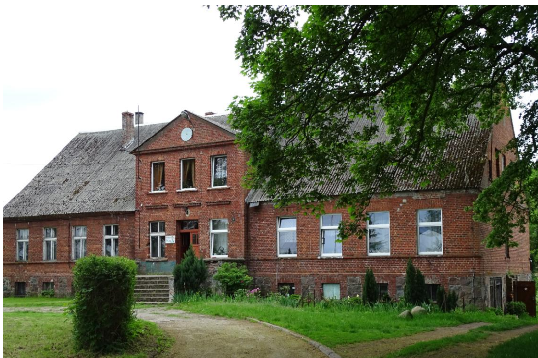
Widok ogólny od płn.-zachodu

8. Fotografia z opisem wskazującym orientację albo mapa z zaznaczonym stanowiskiem archeologicznym