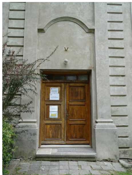
Drzwi i detal w elewacji południowej