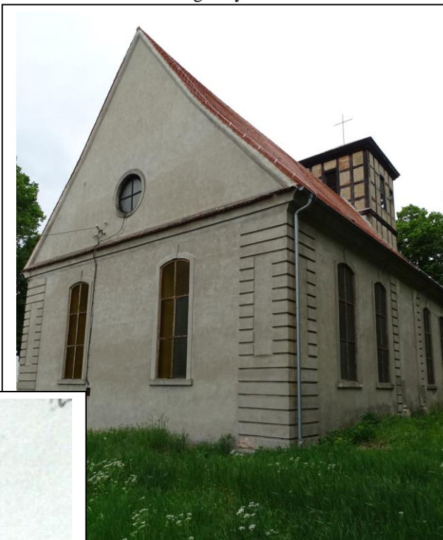
Widok ogólny od płn.-wschodu