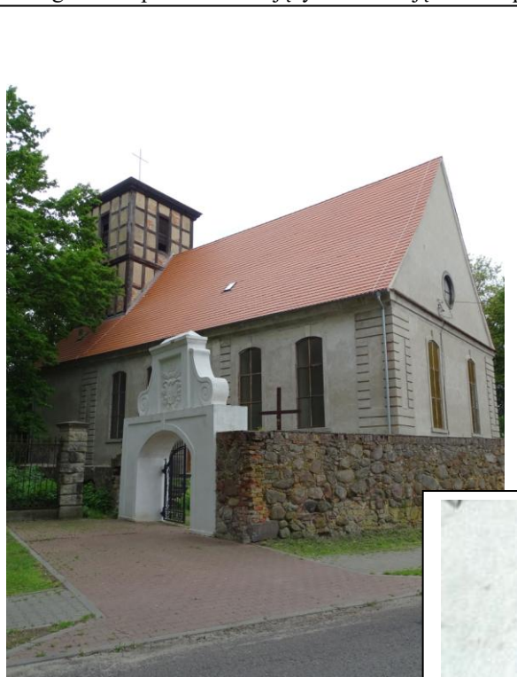
Widok ogólny od południa

8. Fotografia z opisem wskazującym orientację albo mapa z zaznaczonym stanowiskiem archeologicznym