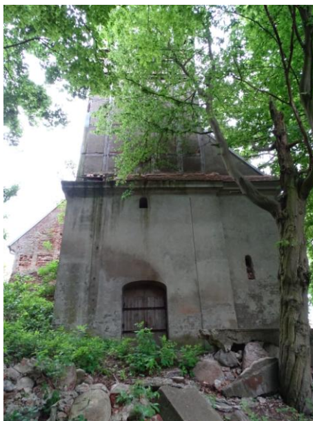
Elewacja zachodnia (z wieżą)