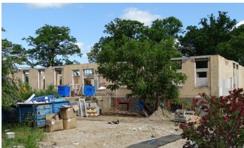
Elewacja frontowa (południowa) – remont 2019 r.

8. Fotografia z opisem wskazującym orientację albo mapa z zaznaczonym stanowiskiem archeologicznym