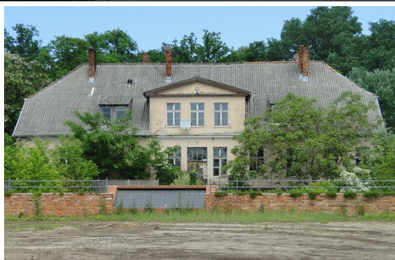
Elewacja frontowa (południowa) – 2016 r.