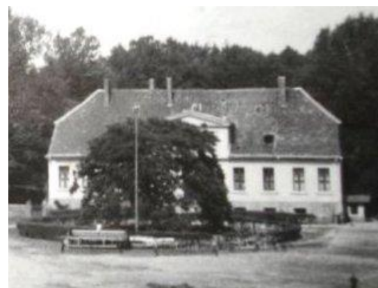
Widok sprzed 1939 r.