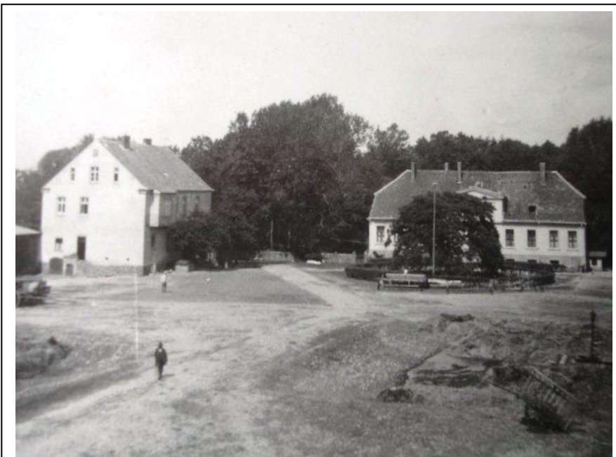
Dwór i podwórze folwarczne – sprzed 1939 r.: folwarskarbimierz.pl/

Dwór wybudowany w 1 poł. XIX w., przebudowany na pocz. XX w., z relikdami (w piwnicach) wcześniejszego obiektu. Jest to niewielka siedziba właściciela ziemskiego, o cechach klasycystycznych; obecnie w trakcie remontu – rozebrany do poziomu ścian parteru. Budynek założony na planie prostokąta, parterowy, podpiwniczony, nakryty wysokim dachem naczółkowym, z mieszkalnym poddaszem, murowany z cegły ceramicznej, tynkowany, osadzony na kamiennym cokole. Elewacje o pierwotnej kompozycji i skromnym wystroju. Fasada 11-osiowa, pierwotnie akcentowana 3-osiowym pseudoryzalitem, zwieńczonym obszerną wystawą, z trójkątnym tympanonem.