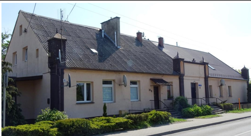
Elewacja frontowa (zachodnia)

8. Fotografia z opisem wskazującym orientację albo mapa z zaznaczonym stanowiskiem archeologicznym