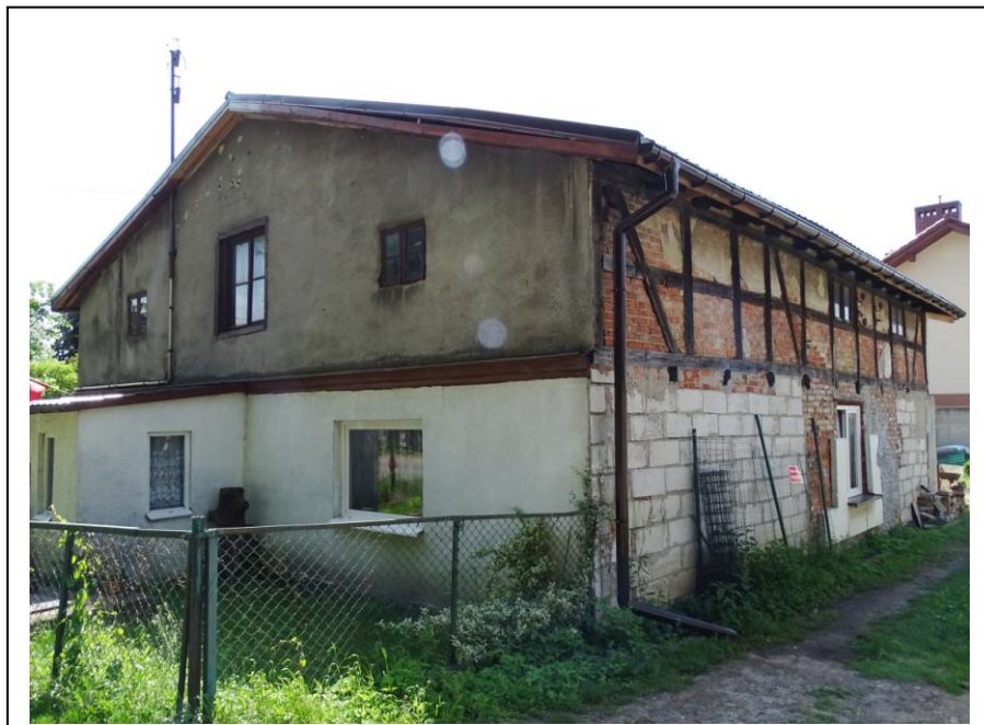
Widok ogólny od płn.-zachodu

Dom mieszkalny położony w sąsiedztwie kościoła, posadowiony szczytem do drogi, o oryginalnej bryle. Budynek założony na planie prostokąta, parterowy, nakryty dachem dwuspadowym, z mieszkalnym poddaszem powiększonym o ściankę kolankową. Ściany pierwotnie wykonane był konstrukcji ryglowej z ceglanym wypełnieniem; obecnie częściowo przemurowane cegła ceramiczną i pustakami, ze fragmentami tynku. Elewacje o wtórnej kompozycji, z powiększonymi otworami okiennymi i nową stolarką. W obrębie poddasza częściowo zachowane oryginalne okna drewniane, 2-skrzydłowe.