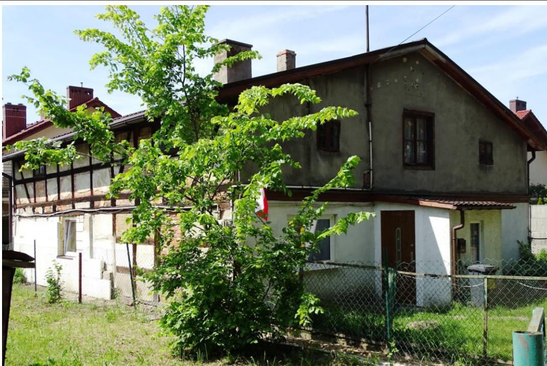
Widok ogólny od płn.-wschodu

8. Fotografia z opisem wskazującym orientację albo mapa z zaznaczonym stanowiskiem archeologicznym