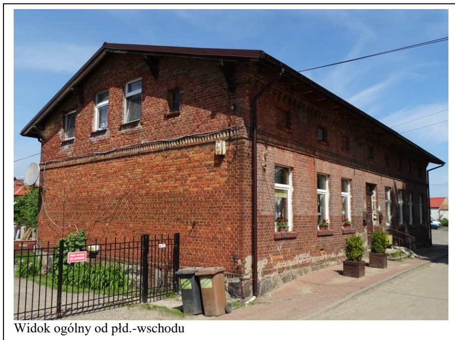
Widok ogólny od płd.-wschodu

Okazały dom mieszkalny, o oryginalnej formie architektonicznej, z elementami wystroju. Budynek założony na planie prostokąta, parterowy, nakryty dachem dwuspadowym, z mieszkalnym poddaszem powiększonym o ściankę kolankową. Ściany murowane z cegły ceramicznej, nietynkowane, osadzone na kamiennym cokole. Elewacje zachowały pierwotną, regularną kompozycję, akcentowane gzymsami pilastymi i schodkowymi (w szczytach) oraz jednorodną kolorystyką i fakturą muru. Fasada 8-osiowa, rytmiczna, z oryginalnymi drzwiami (2-skrzydłowe, płycinowe). Stolarka współczesna, ale osadzona w pierwotnych otworach.