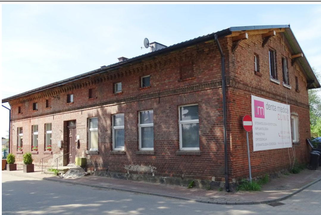
Widok ogólny od płn.-wschodu

8. Fotografia z opisem wskazującym orientację albo mapa z zaznaczonym stanowiskiem archeologicznym