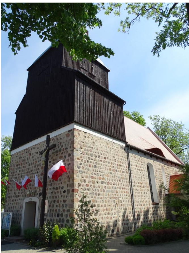
Widok ogólny od pld.-zachodu

8. Fotografia z opisem wskazującym orientację albo mapa z zaznaczonym stanowiskiem archeologicznym