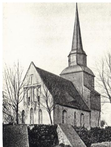
Kościół – widok z pocz. XX w.