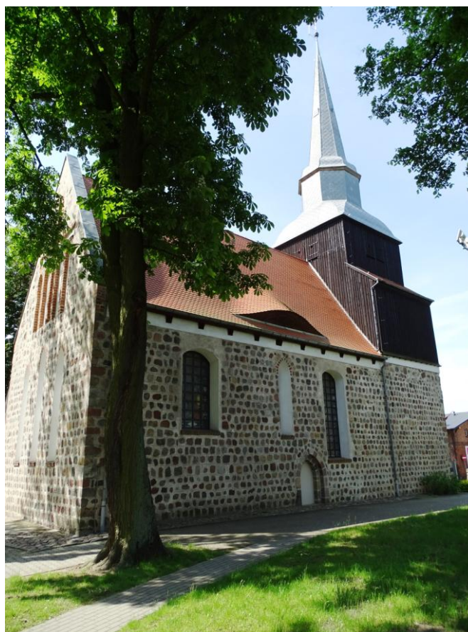
Widok ogólny od pñ.-wschodu