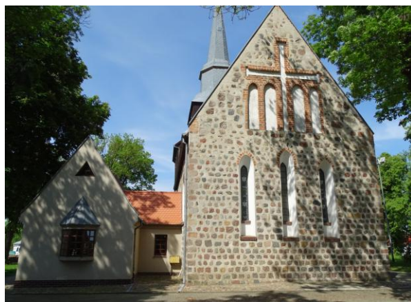
Widok ogólny od wschodu