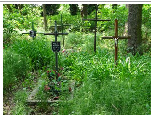
Krzyże – po 1945 r.