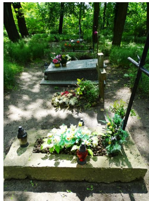
Kwaterna z nagrobkami – po 1945 r.