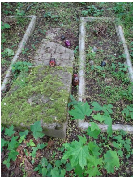
Obudowy historycznych nagrobków

Cmentarz założono w poł. XIX w., jako nekropolię ewangelicką. Użytkowany po II wojnie światowej (w l. 1945-55); obecnie nieczynny. Układ regularny, czworoboczny, dwualejowy, trzykwaterowy, z dwoma wejściami od wschodu. Teren częściowo wygrodzony kamiennym murem, z filarami bramnymi. Na cmentarzu zachowany komponowany starodrzew: klony jawory, jesiony oraz pojedyncze lipy, kasztanowce i robinie. Licznie zachowane historyczne nagrobki (lub elementy) wykonane ze sztucznego kamienia: stele i krzyże z inskrypcjami. Na cmentarzu znajdują się współczesne mogiły i nagrobki (z l. 40. i 50. XX w.).