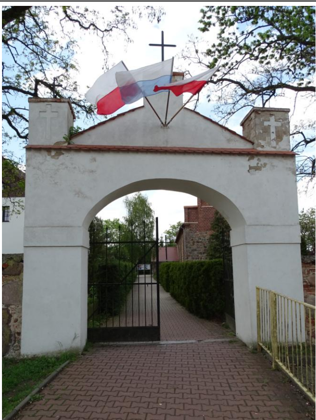
Widok ogólny od wschodu

8. Fotografia z opisem wskazującym orientację albo mapa z zaznaczonym stanowiskiem archeologicznym