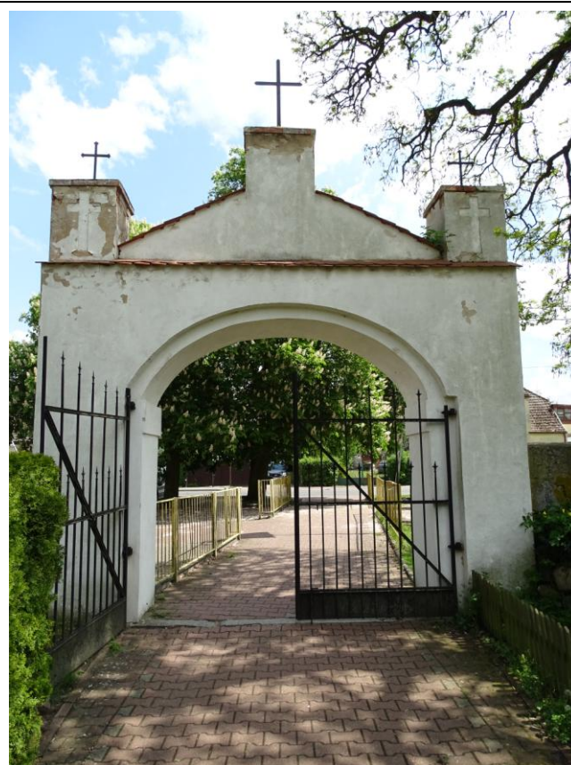
Widok ogólny od zachodu