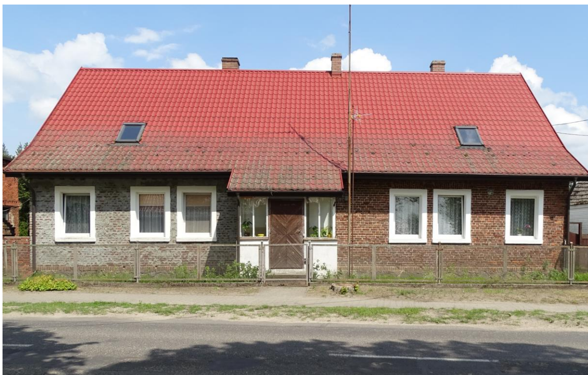
Elewacja frontowa - południowa

8. Fotografia z opisem wskazującym orientację albo mapa z zaznaczonym stanowiskiem archeologicznym