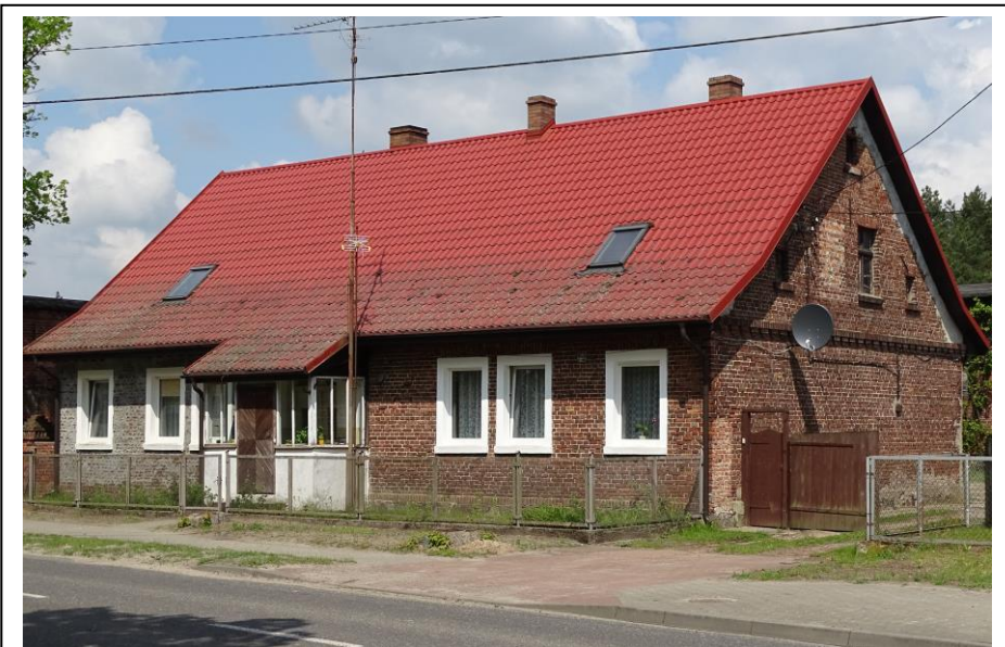
Widok ogólny od płd.-wschodu

Okazały dom mieszkalny, w ramach zagrody chłopskiej, o oryginalnej formie architektonicznej. Budynek założony na planie wydłużonego prostokąta, parterowy, nakryty dachem dwuspadowym, z częściowo mieszkalnym poddaszem. Ściany murowane z cegły ceramicznej, nietynkowane, osadzone na kamiennym cokole. Fasada 7-osiowa, lustrzanie symetryczna, zwieńczona gzymsem schodkowo-ząbkowym. Stolarka okienna współczesne, a otwory ujęte nowymi, tynkowanymi opaskami.