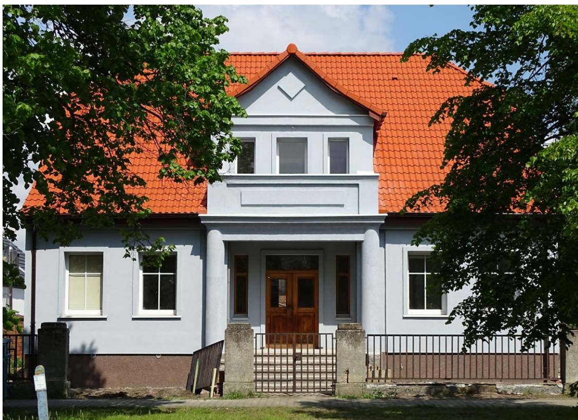
Elewacja frontowa - południowa

8. Fotografia z opisem wskazującym orientację albo mapa z zaznaczonym stanowiskiem archeologicznym