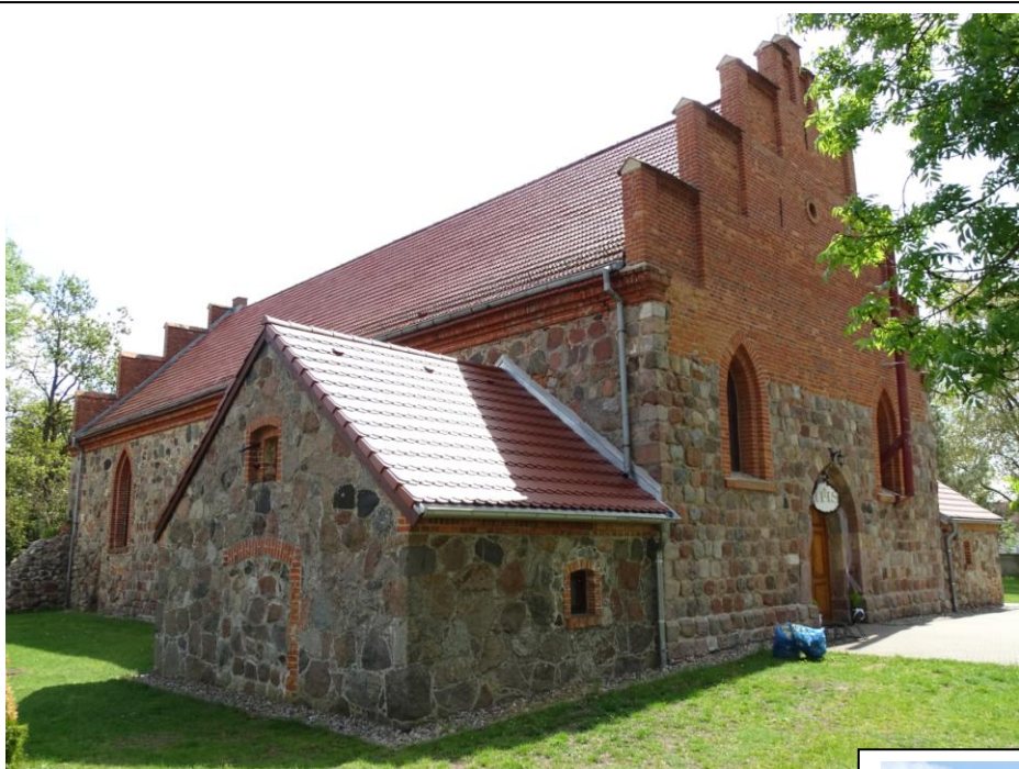
Widok ogólny od pñ.-zachodu

8. Fotografia z opisem wskazującym orientację albo mapa z zaznaczonym stanowiskiem archeologicznym