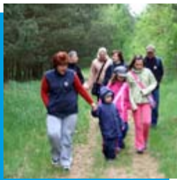
Wiosenny Rajd Pieszy