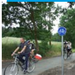
Rajd Rowerowy Buk – Blankensee (Niemcy)