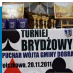
Turniej Brydża Sportowego o Puchar Wójta Gminy Dobra