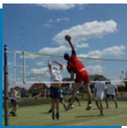
Turniej Piłki Siatkowej o Puchar Przewodniczącego Rady Gminy Dobra