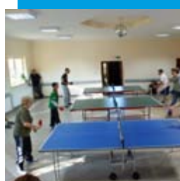
Turniej Tenisa Stołowego o Puchar Wójta Gminy Dobra