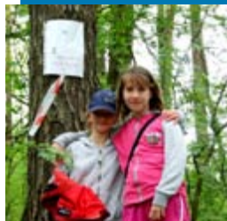
Jesienny Rajd Pieszy