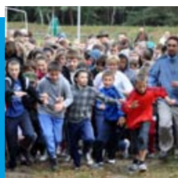
Biegi Przelajowe „Gmina Dobra Biega”