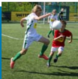
„Mundial na bis”- Turniej Piłki Nożnej Szkół Podstawowych o Puchar Wójta Gminy Dobra