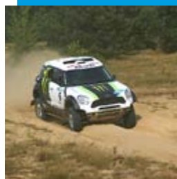
Rajd Baja Poland