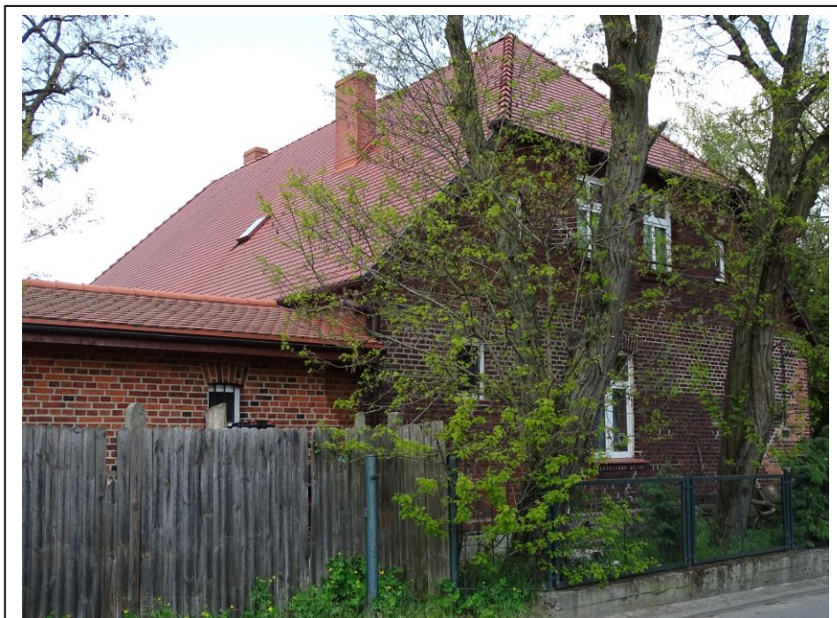
Widok od pld.-wschodu

Okazały dom mieszkalny, pierwotnie (i obecnie) pełniący funkcje plebani. Budynek założony na planie prostokąta, parterowy, podpiwniczony, nakryty dachem naczółkowym, z mieszkalnym poddaszem. Ściany murowane z cegły ceramicznej, tynkowane, osadzone na kamiennym cokole. Elewacje zachowały pierwotną kompozycję, akcentowane skromnym (ceglanym) detalem architektonicznym. Fasada 7-osiowa, lustrzanie symetryczna, zwieńczona gzymsem schodkowym, a otwory ujęte odcinkowymi nadprożami. Zachowane pierwotne drzwi frontowe: 2-skrzydłowe, płycinowe. Okna współczesna, odwzorowująca pierwotne formy.