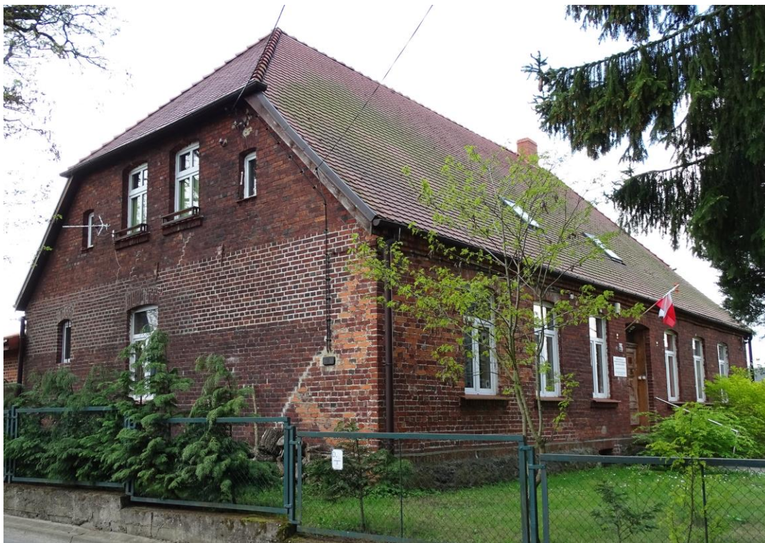
Widok ogólny od płn.-wschodu

8. Fotografia z opisem wskazującym orientację albo mapa z zaznaczonym stanowiskiem archeologicznym