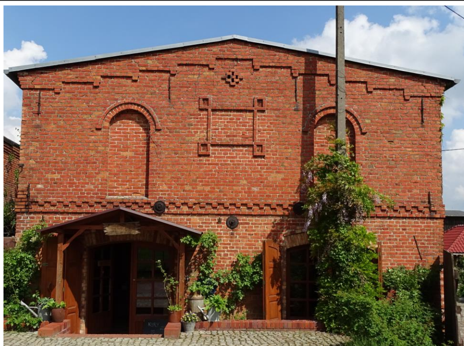
Elewacja frontowa - południowa

Budynek gospodarczy w ramach dużej zagrody chłopskiej, o historycznej formie architektonicznej, z elementami detalu; obecnie użytkowany na cele handlowe. Budynek posadowiony szczytem do drogi, założony na planie prostokąta, parterowy, nakryty płaskim dachem dwuspadowym, z poddaszem składowym powiększonym o ściankę kolankową. Ściany murowane z cegły ceramicznej, nietynkowane. Elewacje dzielone gzymsami ząbkowymi i schodkowymi. W szczycie południowym dwie, pełnołukowe blendy oraz czworoboczna dekoracja ceglana.