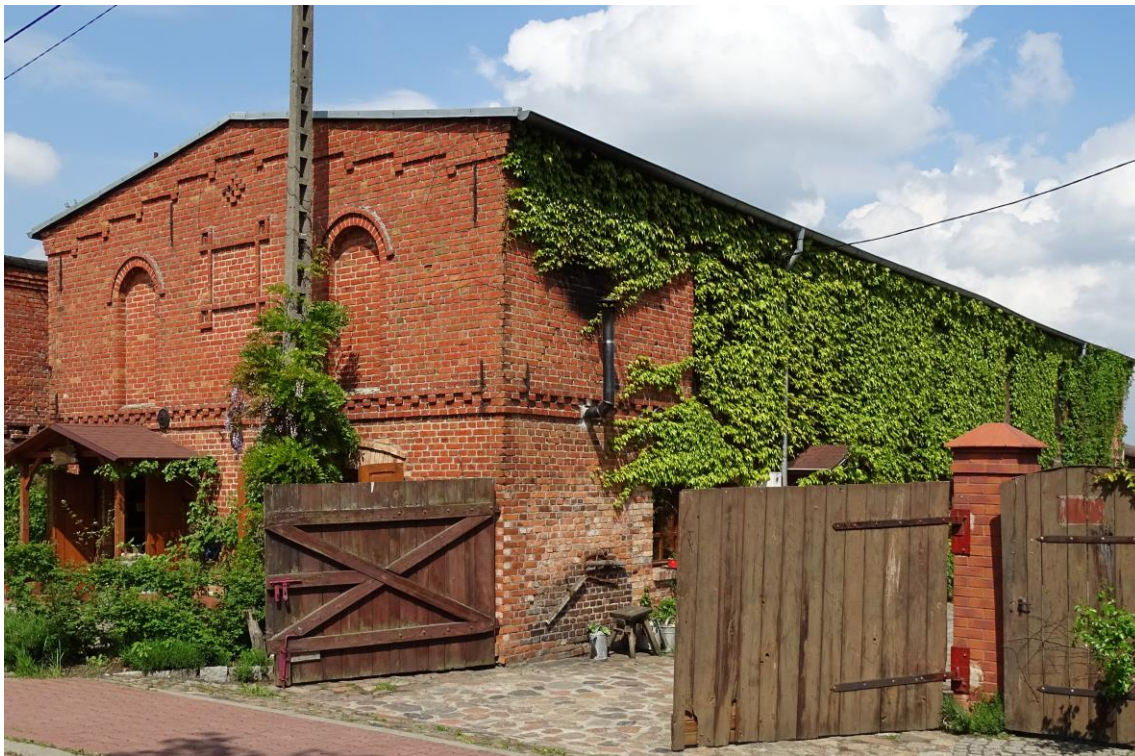
Widok ogólny od płd.-wschodu

8. Fotografia z opisem wskazującym orientację albo mapa z zaznaczonym stanowiskiem archeologicznym