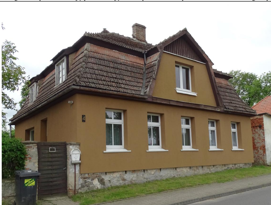
Widok ogólny od północy

8. Fotografia z opisem wskazującym orientację albo mapa z zaznaczonym stanowiskiem archeologicznym