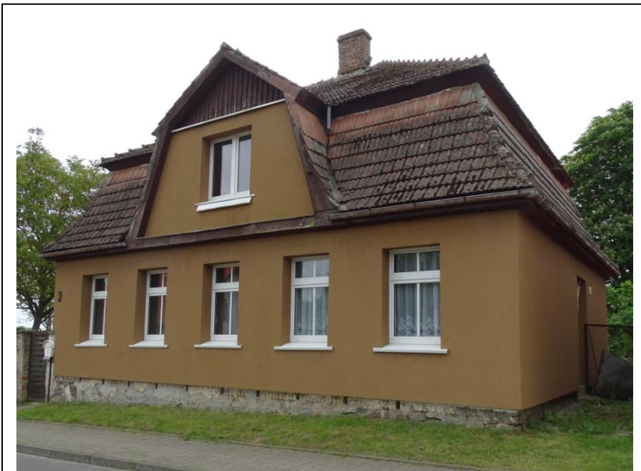
widok ogólny od zachodu

Budynek założony na planie prostokąta, parterowy, nakryty wysokim dachem mansardowym (pokrycie dachówkowe) z wystawką frontową i bocznymi lukarnami. Ściany murowane z cegły ceramicznej, tynkowane (wtórnie ocieplone). Elewacje o pierwotnej, regularnej kompozycji, bezstylowe. Stolarka okienna wtórna, ale odzwierciedlająca dawne formy.