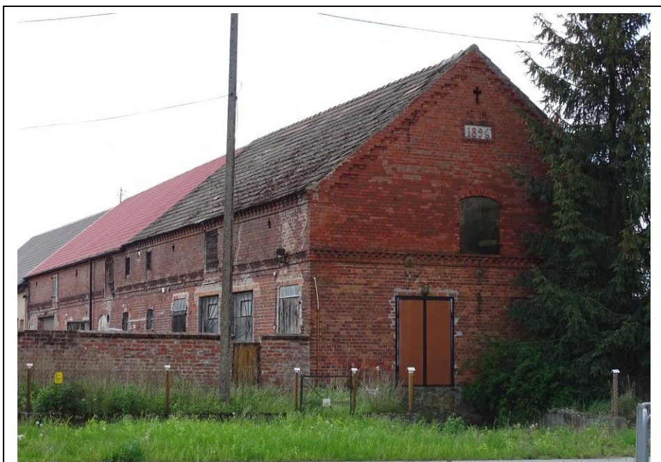
Widok ogólny od płn.-wschodu

Budynek gospodarczy w ramach dużej zagrody chłopskiej, o historycznej formie architektonicznej, z elementami detalu. Budynek posadowiony wzdłuż drogi dojazdowej do nawsia, założony na planie prostokąta, parterowy, nakryty wysokim dachem dwuspadowym, z poddaszem składowym powiększonym o ściankę kolankową. Ściany murowane, kamienno-ceglane, nietynkowane. Elewacje dzielone gzymsami pilastymi i ząbkowymi, a otwory w części zwieńczone łukami odcinkowymi. W szczycie północnym inicjały nazwiska właściciela i datownik [CM 1896].