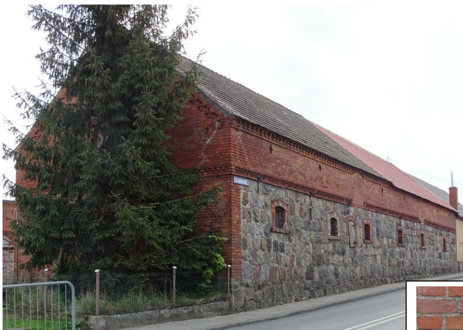
Widok ogólny od pñ.-zachodu

8. Fotografia z opisem wskazującym orientację albo mapa z zaznaczonym stanowiskiem archeologicznym