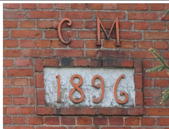
Datownik w szczycie północnym