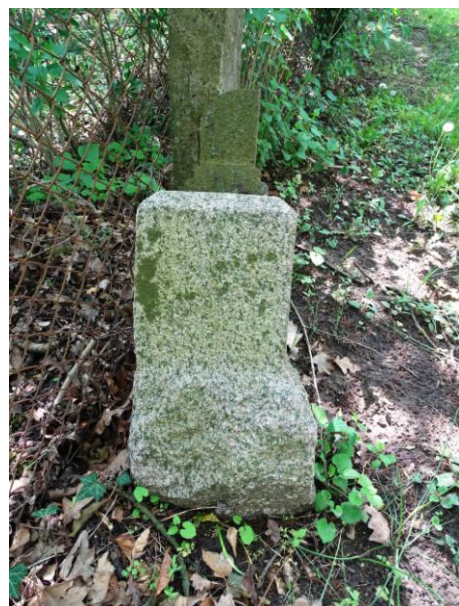
Podstawa nagrobka - krzyża