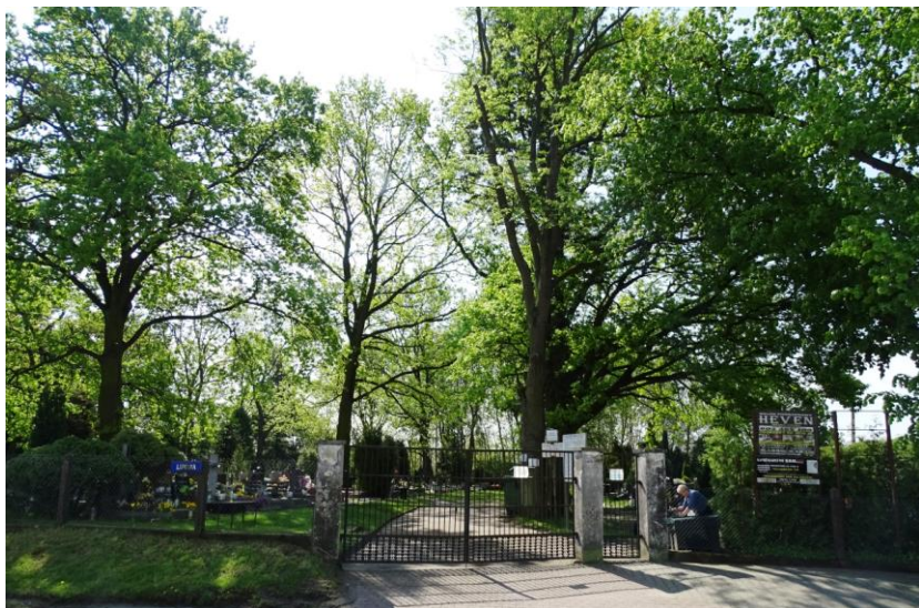
Widok ogólny od południa (z ulicy)

8. Fotografia z opisem wskazującym orientację albo mapa z zaznaczonym stanowiskiem archeologicznym