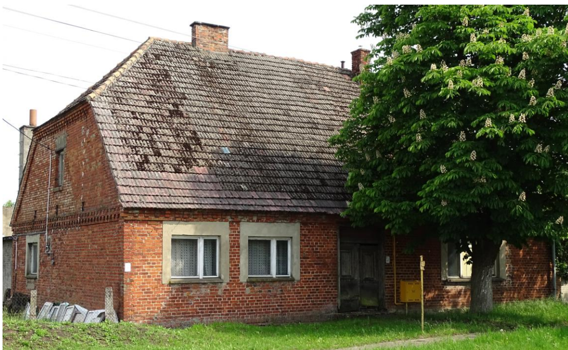
Widok ogólny od płn.-zachodu

8. Fotografia z opisem wskazującym orientację albo mapa z zaznaczonym stanowiskiem archeologicznym