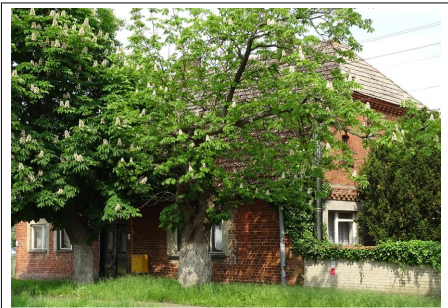
Widok ogólny od płd.-zachodu

Dom mieszkalny w typie chałupy, posadowiony na froncie trzybudynkowej zagrody. Budynek założony na planie prostokąta, parterowy, nakryty dachem naczółkowym, z częściowo użytkowym poddaszem. Ściany murowane z cegły ceramicznej, nietynkowane, opięte gzymsami ząbkowymi. Elewacje częściowo przekształcone, z poszerzonymi otworami okiennymi; fasada obecnie 4-osiowa. Zachowane oryginalne drzwi frontowe: dwuskrzydłowe, płycinowe.