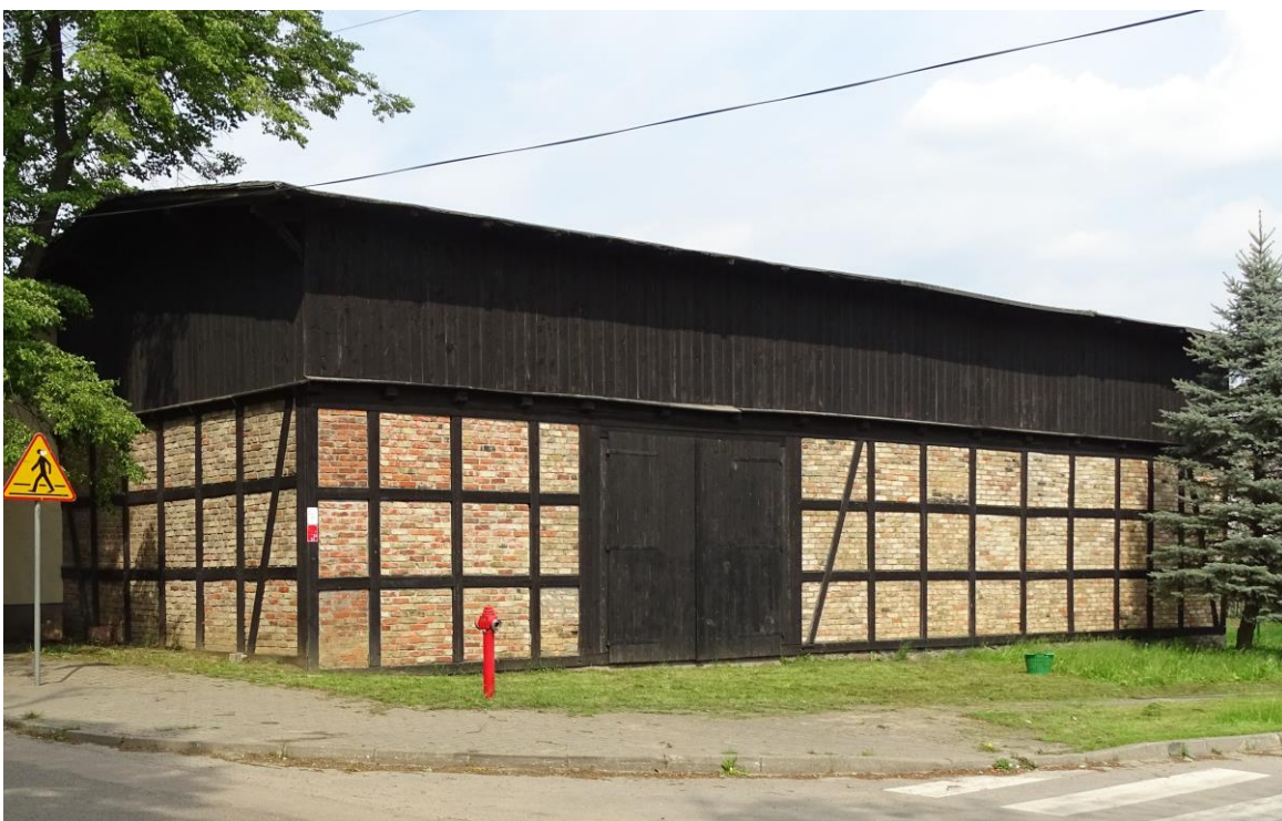
Widok ogólny od południa

8. Fotografia z opisem wskazującym orientację albo mapa z zaznaczonym stanowiskiem archeologicznym