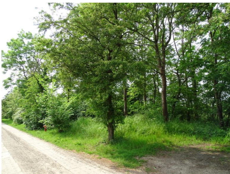
Widok ogólny wschodu

8. Fotografia z opisem wskazującym orientację albo mapa z zaznaczonym stanowiskiem archeologicznym