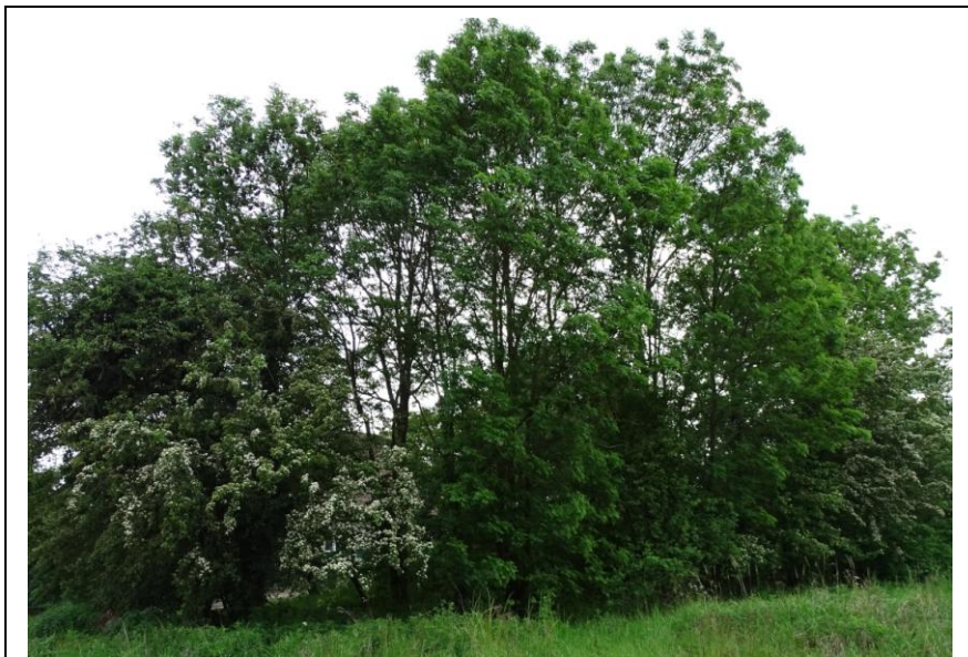
Widok ogólny od północy

Cmentarz zlokalizowany po wschodniej stronie wsi, przy drodze polnej. Jest to niewielka nekropolia (ok. 0,14 ha), o regularnym, trapezowatym założeniu. Układ kwater zatarty, brak widocznych (naziemnych) śladów sepulkralnych. Obrzeża obsadzone żywopłotem głogowym, a wewnątrz silnie zakrzewione i porośnięte wysoką trawą. Pośrodku cmentarza rośnie okazały świerk.