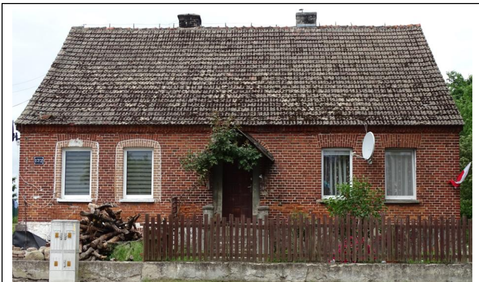
Elewacja frontowa - wschodnia

Dom mieszkalny w typie niewielkiej chałupy, w obrębie trzybudynekowej zagrody. Budynek założony na planie prostokąta, parterowy, podpiwniczony, nakryty dachem dwuspadowym, z częściowo mieszkalnym poddaszem. Elewacje zachowały pierwotną, regularną kompozycję, akcentowane gzymsami ząbkowymi i kostkowymi oraz nadprożami okiennymi. Fasada 5-osiowa, lustrzanie symetryczna. Stolarka współczesna, ale osadzona w pierwotnych otworach.