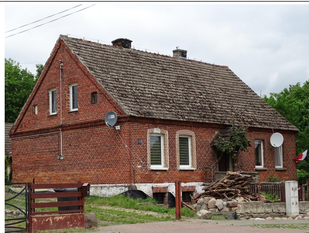
Widok ogólny od płd.-wschodu

8. Fotografia z opisem wskazującym orientację albo mapa z zaznaczonym stanowiskiem archeologicznym