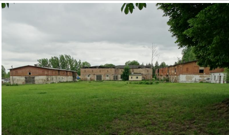
Podwórze folwarczne – widok od północy

8. Fotografia z opisem wskazującym orientację albo mapa z zaznaczonym stanowiskiem archeologicznym