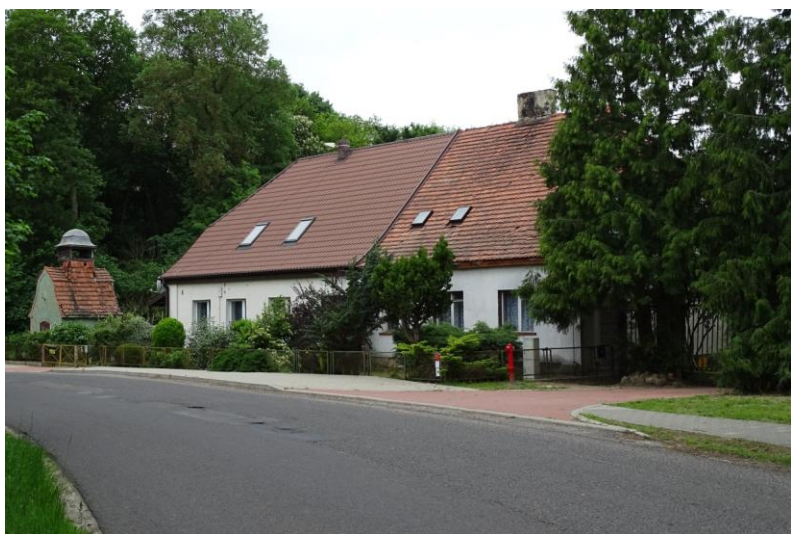
Zabudowa po zachodniej stronie drogi wiejskiej

Zespół budynków gospodarczych nie jest użytkowany, częściowo zrujnowany.