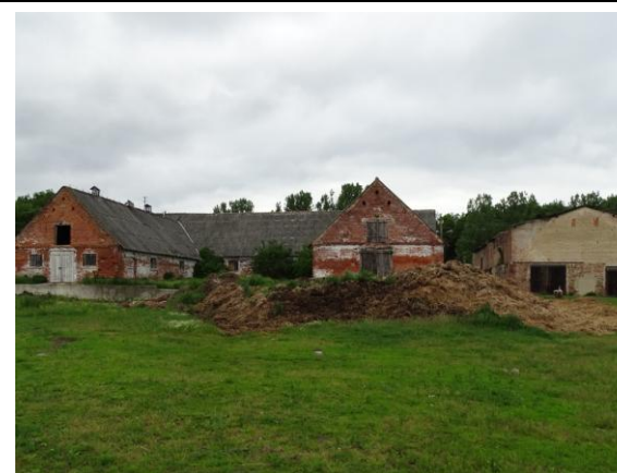
Dziedziniec folwarczny – widok od wschodu