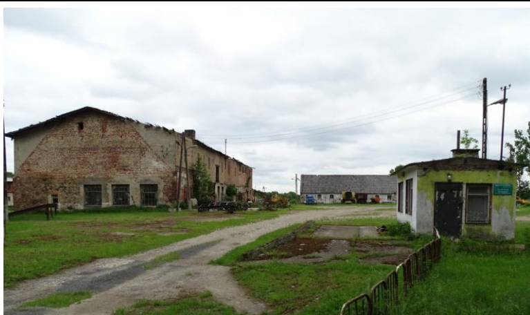
Podwórze folwarczne – widok od zachodu