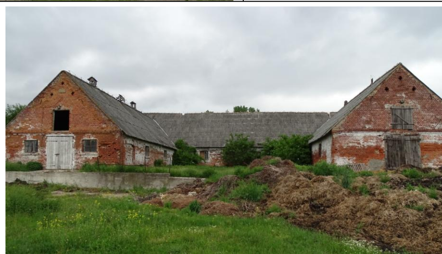
Widok ogólny od wschodu