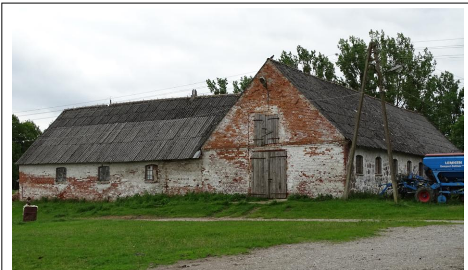
Widok ogólny od północy

Dawna obora stanowiskowa wybudowana w 2 poł. XIX w. i rozbudowana o dwa skrzydła w 1890 r. (o czym świadczy datownik w szczycie wschodnim). Budynek założony na obrysie zbliżonym do litery „C”, trzyskrzydłowy, parterowy z poddaszami składowymi, nakryty wysokimi dachami dwuspadowymi. Korpus (budynek zachodni) wzniesiony z kamienia polnego, miejscami przemurowany cegłą ceramiczną, częściowo bielony. Pozostałe skrzydła murowane z cegły ceramicznej, nietynkowane. Budynki zachowały pierwotne kompozycje elewacji oraz w większości oryginalne formy otworów okiennych z odcinkowymi nadprożami.