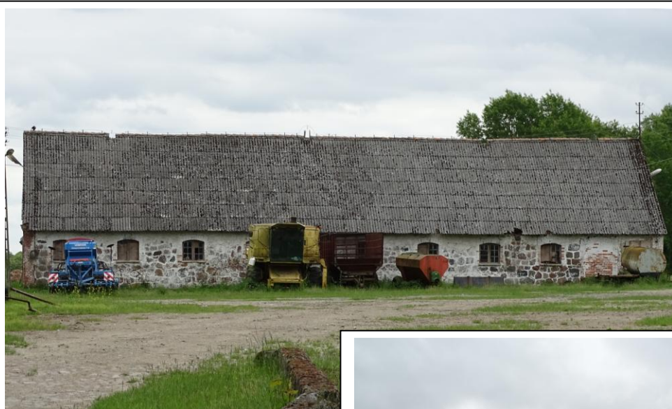
Widok ogólny od zachodu

8. Fotografia z opisem wskazującym orientację albo mapa z zaznaczonym stanowiskiem archeologicznym