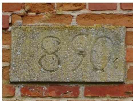
Datownik w szczycie wschodnim