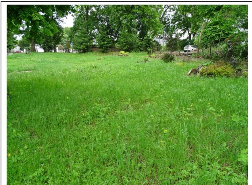
Zachodnia część cmentarza

Cmentarz założony równocześnie z budową świątyni – w 2 poł. XIII w. Układ regularny, czworoboczny. Teren wygradzony od wschodu XVII-wiecznym murem kamiennym z ceglanymi łukami oporowymi, z wejściami od południa i wschodu. Zachowany starodrzew: lipy oraz pojedyncze wiąz i dęby. Brak widocznych elementów sepulkralnych. W części południowej kamienna stela pomnika ku czci poległych w czasie I wojny światowej.