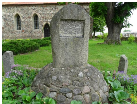
Upamiętnienie I wojny światowej