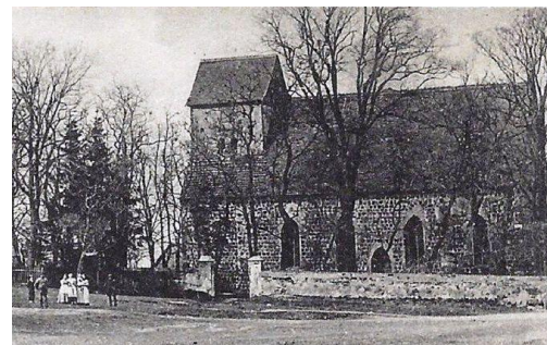
Kościół i cmentarz – 1903 r.