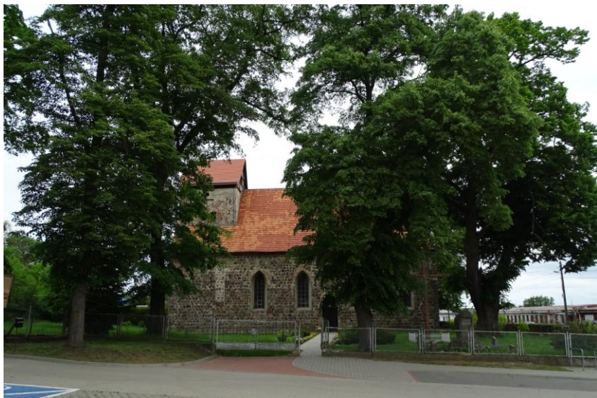
Widok ogólny od południa

8. Fotografia z opisem wskazującym orientację albo mapa z zaznaczonym stanowiskiem archeologicznym