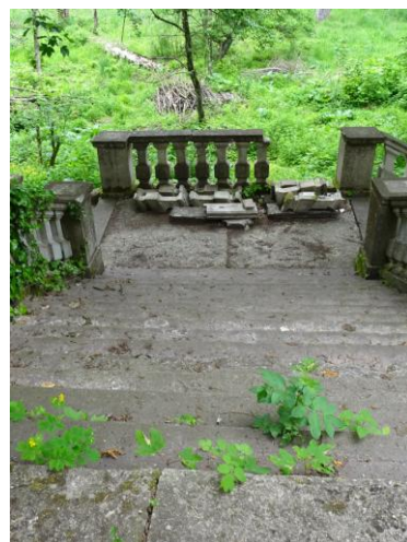
Schody w stronę jeziora