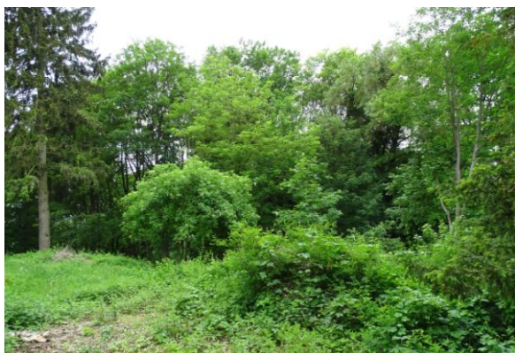
Park po północnej stronie pałacu