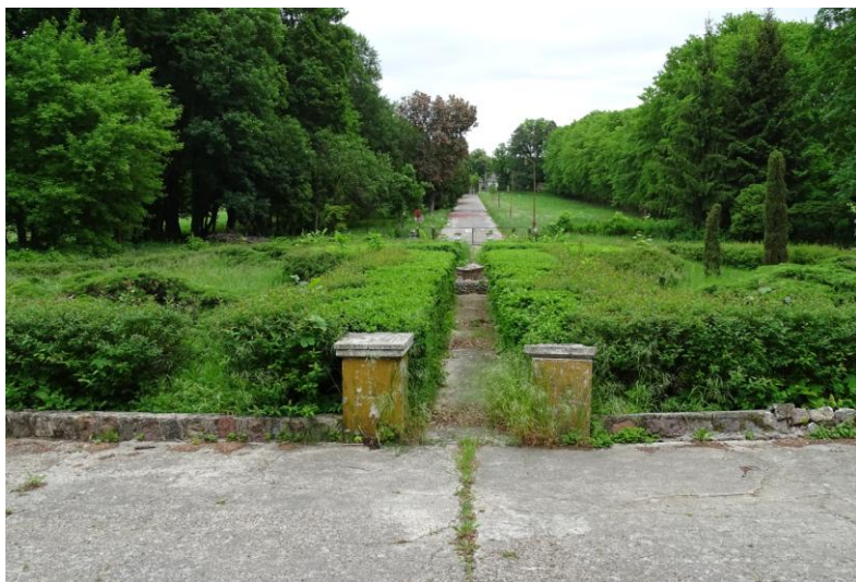
Widok ogólny dziedzińca parkowego przy pałacu

8. Fotografia z opisem wskazującym orientację albo mapa z zaznaczonym stanowiskiem archeologicznym