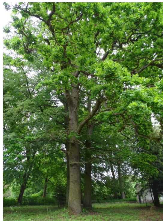
Starodrzew przy pałacu