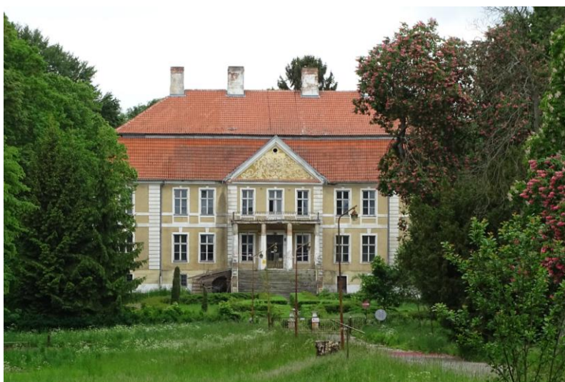
Widok ogólny przez dziedziniec parkowy