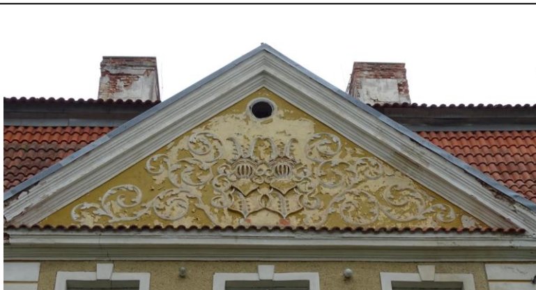
Tympanon z herbem von Ramin