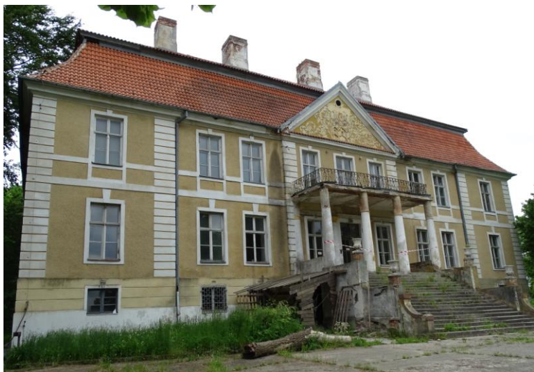
Elewacja frontowa - wschodnia

8. Fotografia z opisem wskazującym orientację albo mapa z zaznaczonym stanowiskiem archeologicznym