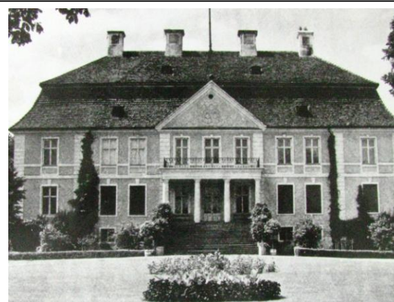
Pałac – ok. 1930 r.