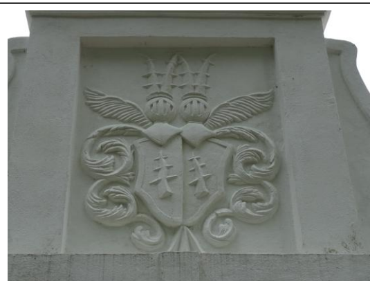
Herb v. Ramin na barokowej bramce