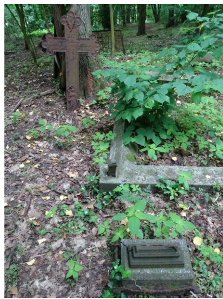
Pozostałości nagrobków i żeliwne krzyże