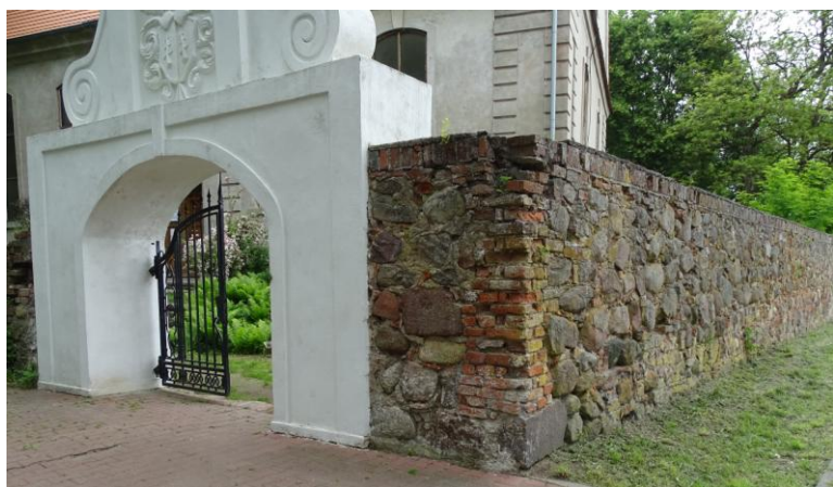
Kamienne ogrodzenie z barokową bramką

8. Fotografia z opisem wskazującym orientację albo mapa z zaznaczonym stanowiskiem archeologicznym