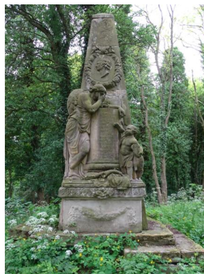
Pomnik v. Ramin