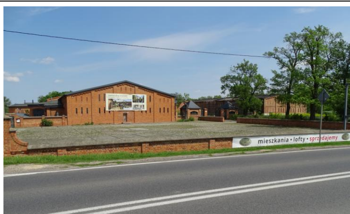
Widok ogólny od zachodu