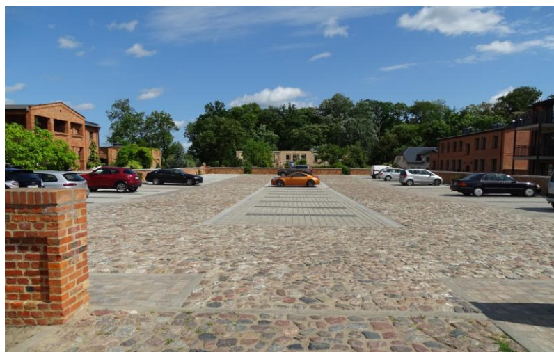
Podwórze popolwarczne – część północna (z dworem)

8. Fotografia z opisem wskazującym orientację albo mapa z zaznaczonym stanowiskiem archeologicznym