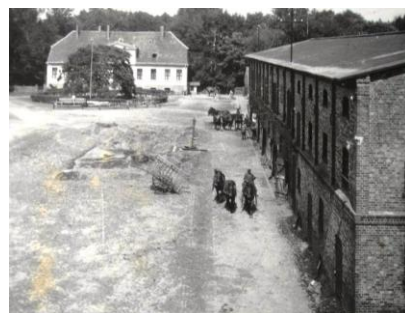
Widok sprzed 1939 r.