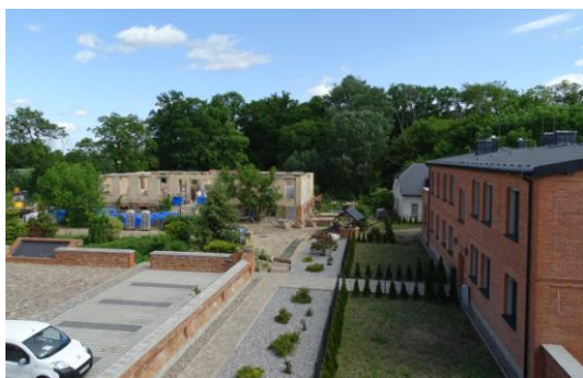
Północna część podwórza