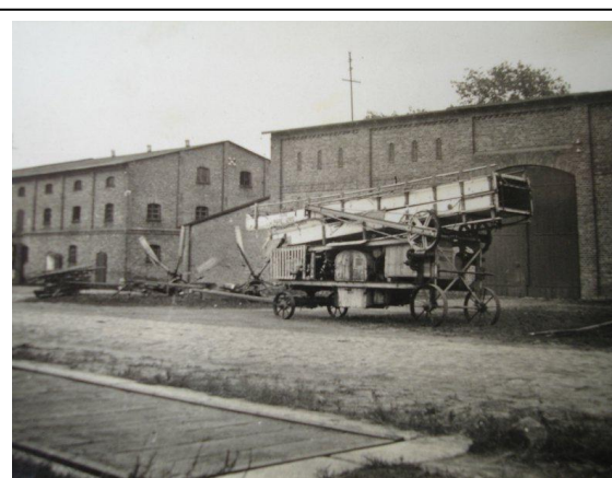
Widok sprzed 1939 r.: www.folwarkskarbimierz.pl