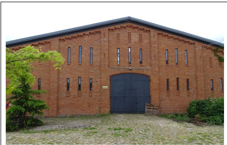
Elewacja szczytowa (północna)

Dawna stodoła w zespole folwarcznym, ulokowana na froncie podwórza, po kompleksowym remoncie i rewaloryzacji. Jest to budynek wielokubaturowy, założony na planie prostokąta (z wtórną przybudówką od zachodu), parterowy, nakryty płaskim dachem dwuspadowym. Ściany murowane z cegły ceramicznej, nietynkowane. Elewacje o pierwotnej kompozycji i wystroju, dzielone szerokimi blendami (po dawnych wrotach) z łukami odcinkowymi, lizenami, gzymsami schodkowymi oraz ciągiem szczelinowych otworów wentylacyjnych. Pośrodku fasady umieszczony datownik z inicjałami właściciela majątku [MR 1905].