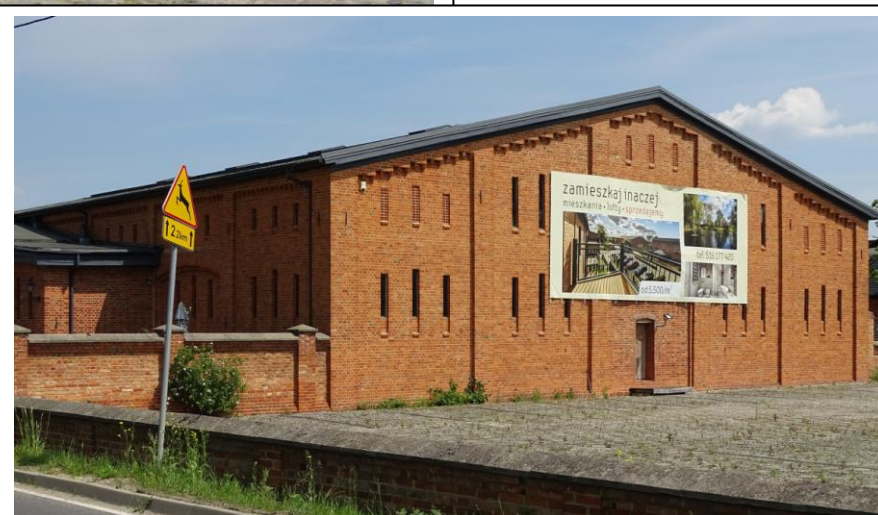
Widok ogólny od pld.-zachodu