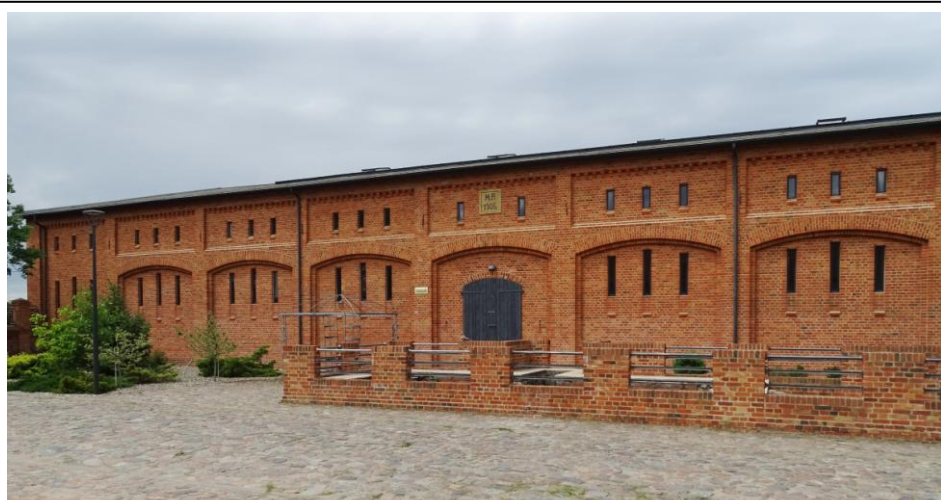
Elewacja wschodnia (podwórzowa)

8. Fotografia z opisem wskazującym orientację albo mapa z zaznaczonym stanowiskiem archeologicznym