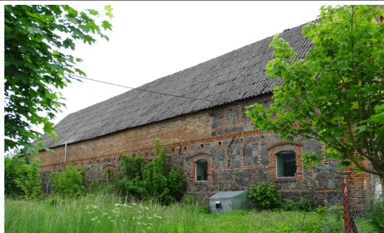
Widok ogólny od północy