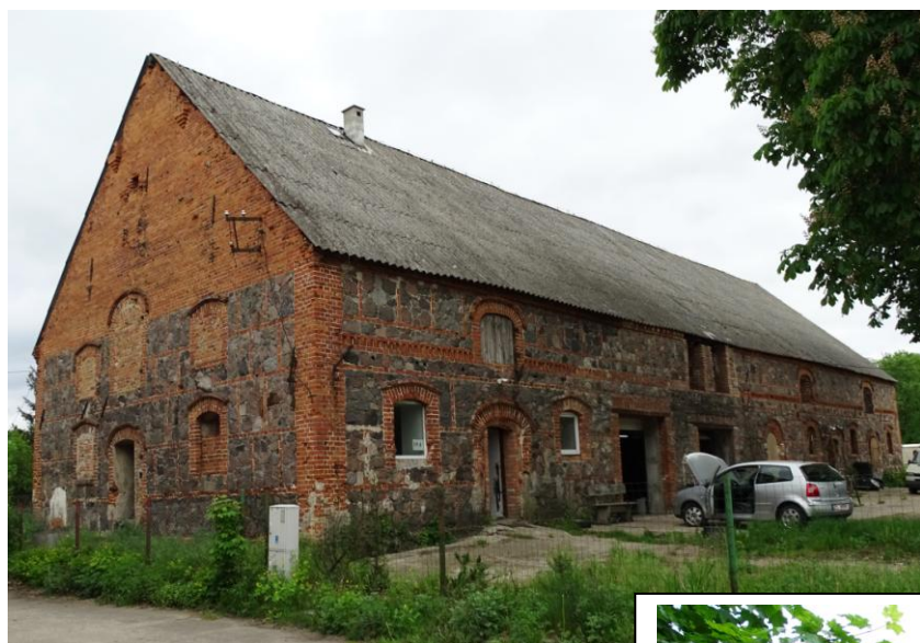
Widok ogólny od płd.-zachodu

8. Fotografia z opisem wskazującym orientację albo mapa z zaznaczonym stanowiskiem archeologicznym