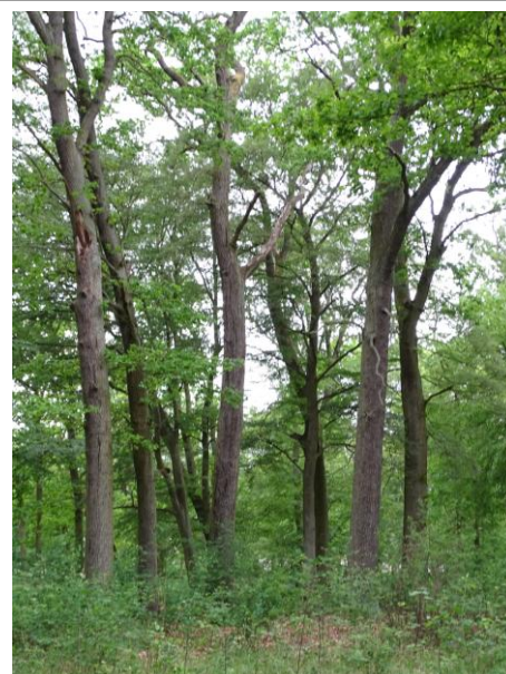
Drzewostan pośrodku parku