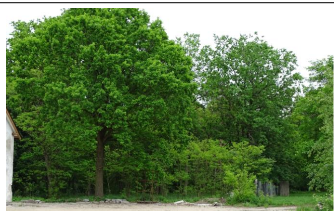
Widok ogólny od zachodu

STARSZY KUSTOŚZ Biura Dokumentacji Zabytków w Szczecinie Małgorzata Witek