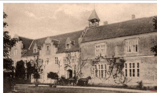
Pałac – widok z pocz. XX w.