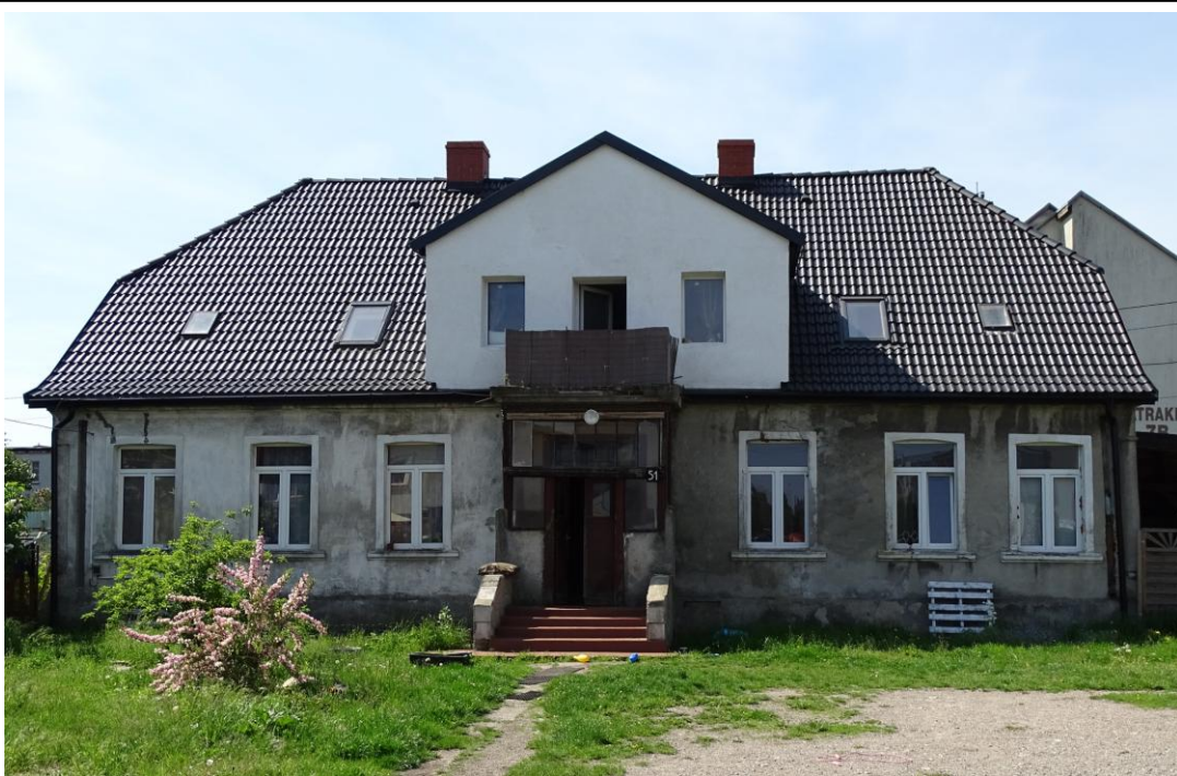
Elewacja frontowa - północna

8. Fotografia z opisem wskazującym orientację albo mapa z zaznaczonym stanowiskiem archeologicznym