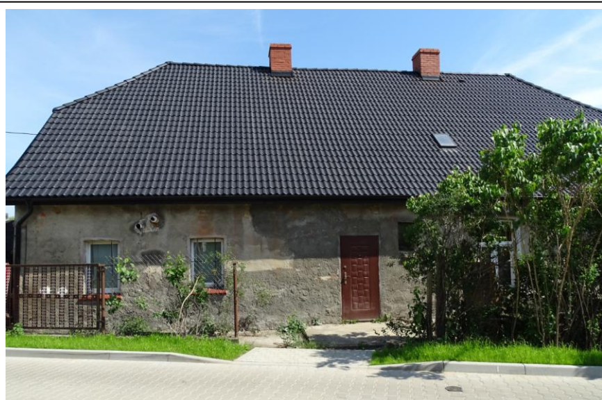
Elewacja tylna - południowa

Budynek założony na planie wydłużonego prostokąta, parterowy, nakryty wysokim dachem naczółkowym z frontową wystawą i mieszkalnym poddaszem. Ściany murowane z cegły ceramicznej, tynkowane, bez detalu architektonicznego. Fasada 7-osiowa, lustrzanie symetryczna, zaakcentowana 3-osiowym gankiem z trójkątnym szczytem oraz niewielkim, drewnianym gankiem w formie witryny. Stolarka okienna współczesna, ale odwzorowująca pierwotne formy; otwory okienne ujęte prostymi opaskami.