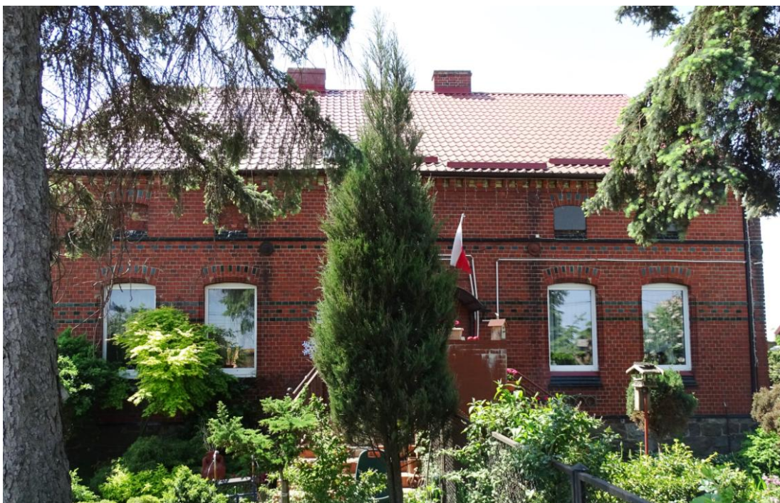
Elewacja frontowa - północna

8. Fotografia z opisem wskazującym orientację albo mapa z zaznaczonym stanowiskiem archeologicznym