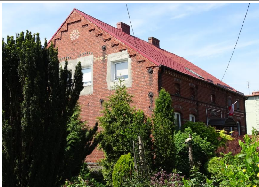
Widok ogólny od płn.-wschodu

Okazały dom mieszkalny, o oryginalnej formie architektonicznej, z elementami wystroju architektonicznym. Budynek założony na planie prostokąta, parterowy, podpiwniczony, nakryty dachem dwuspadowym, z mieszkalnym poddaszem powiększonym o ściankę kolankową. Ściany murowane z cegły ceramicznej, nietynkowane, osadzone na kamiennym cokole. Elewacje zachowały pierwotną, regularną kompozycję, akcentowane detalem: gzymsy kostkowe i schodkowe, fryzy z cegły glazurowanej, odcinkowe nadproża. Fasada 5-osiowa, lustrzanie symetryczna. Stolarka współczesna, ale osadzona w pierwotnych otworach.