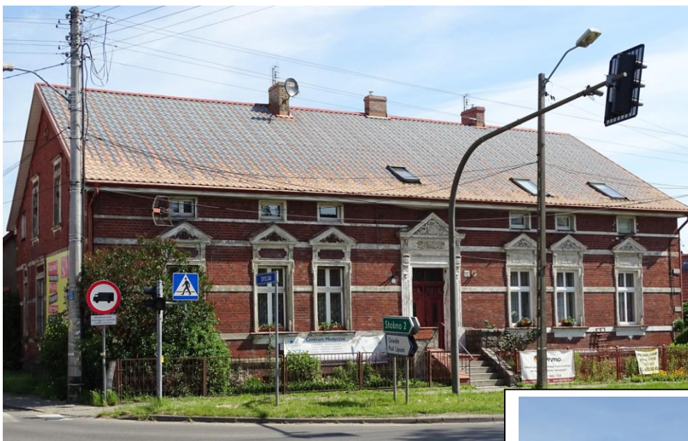
Widok ogólny od pld.-zachodu

8. Fotografia z opisem wskazującym orientację albo mapa z zaznaczonym stanowiskiem archeologicznym