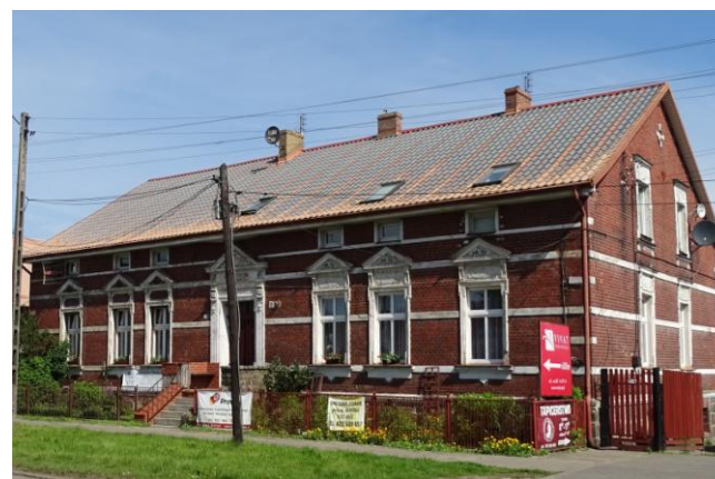
Widok ogólny od pld.-wschodu