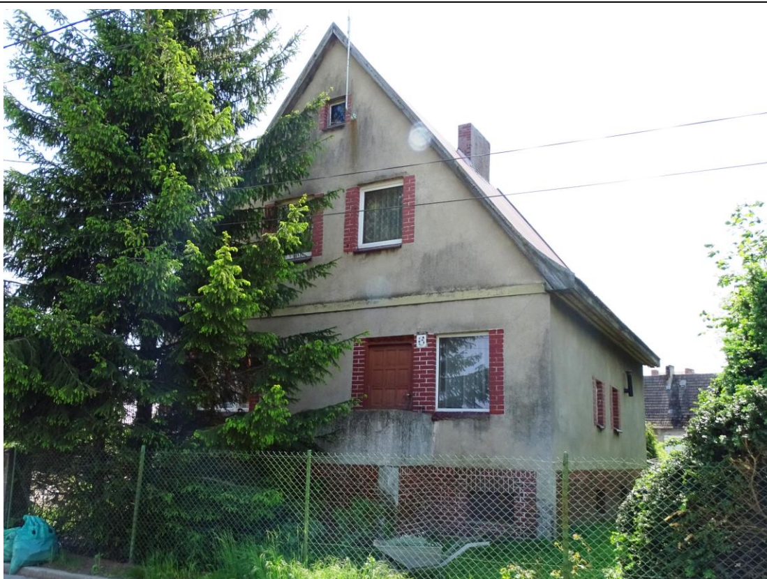
Widok ogólny od płn.-zachodu

8. Fotografia z opisem wskazującym orientację albo mapa z zaznaczonym stanowiskiem archeologicznym