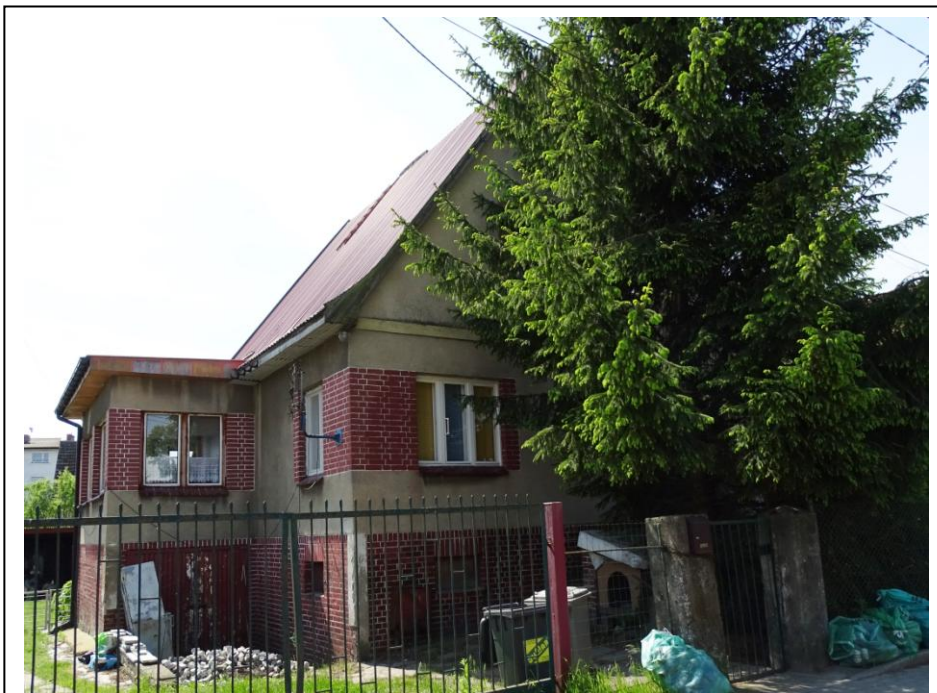
Widok ogólny od półn.-wschodu

Dom mieszkalny w typie niewielkiej willi, posadowionej szczytem do drogi, ulokowanej w I. 30. XX w. na obrzeżach dawnej wsi. Budynek założony na planie zbliżonym do kwadratu, parterowy (z gankiem bocznym), podpiwniczony, nakryty wysokim dachem dwuspadowym z mieszkalnym poddaszem. Ściany murowane z cegły ceramicznej, tynkowane, osadzone na wysokim (ceglanym) cokole. Elewacje o pierwotnej, regularnej kompozycji, akcentowane ceglаныmi obramieniami otworów okiennych. Stolarka okienna wtórna, ale osadzona w pierwotnych otworach.