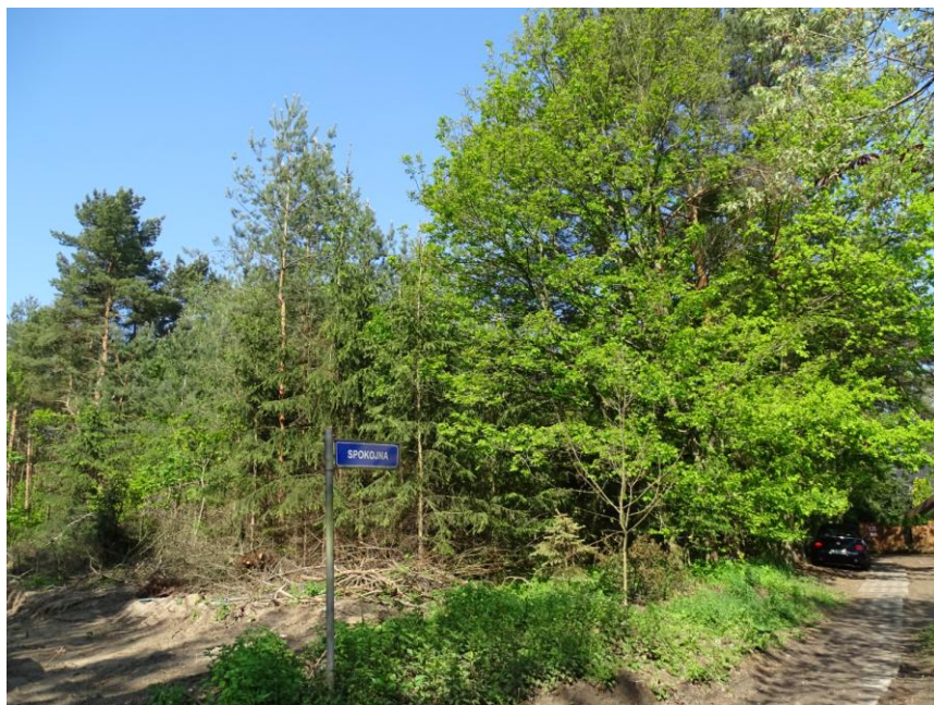
Widok ogólny oz strony drogi

8. Fotografia z opisem wskazującym orientację albo mapa z zaznaczonym stanowiskiem archeologicznym