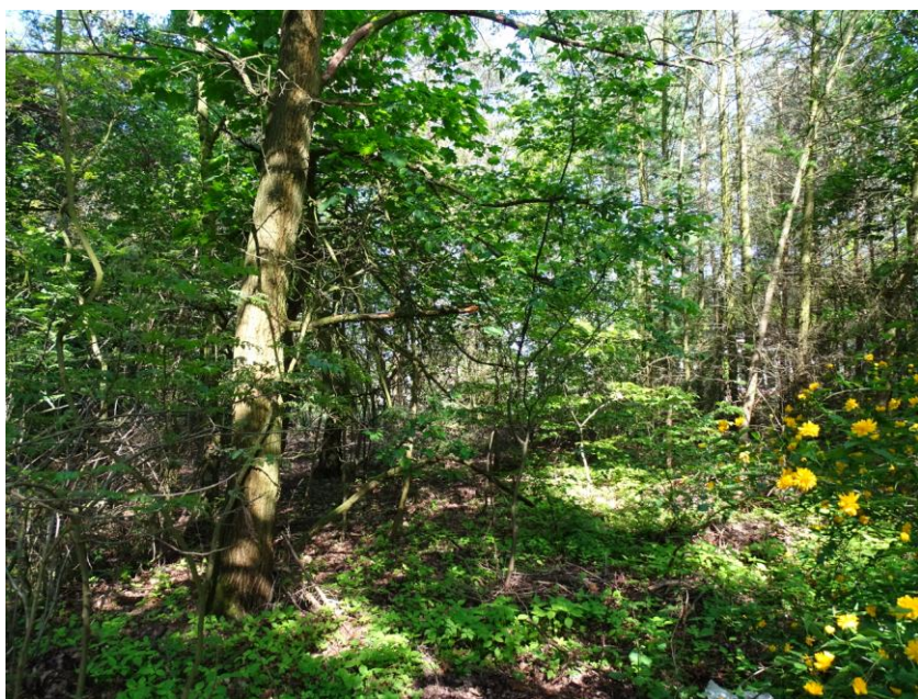
Cmentarz - wewnątrz

Cmentarz założono na pocz. I. 40. XX w., na którym chowano – m.in. - zmarłych żołnierzy przebywających w lazarecie wojskowym (d. schronisku młodzieżowym). Jest to niewielka nekropolia, położona na skraju lasu, silnie zarośnięta, z pojedynczymi elementami pierwotnej zieleni komponowanej (brzozy, topole). Układ kwater zatarty, brak śladów sepulkralnych.