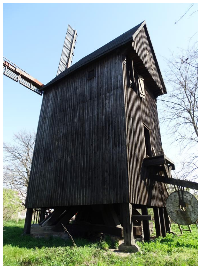
Widok ogólny od pñd.-zachodu