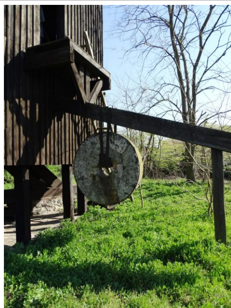
Dyszal z kamieniem młyńskim