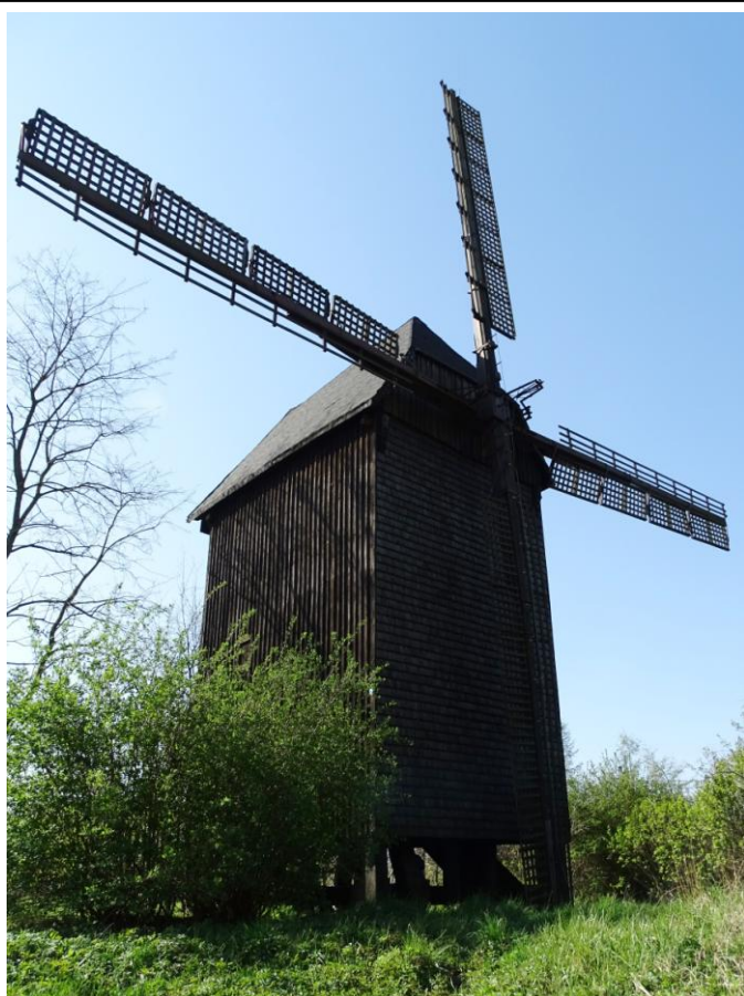
Widok ogólny od pñ.-wschodu

8. Fotografia z opisem wskazującym orientację albo mapa z zaznaczonym stanowiskiem archeologicznym