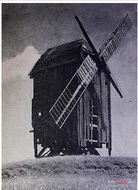
Wiatrak – 1958 r