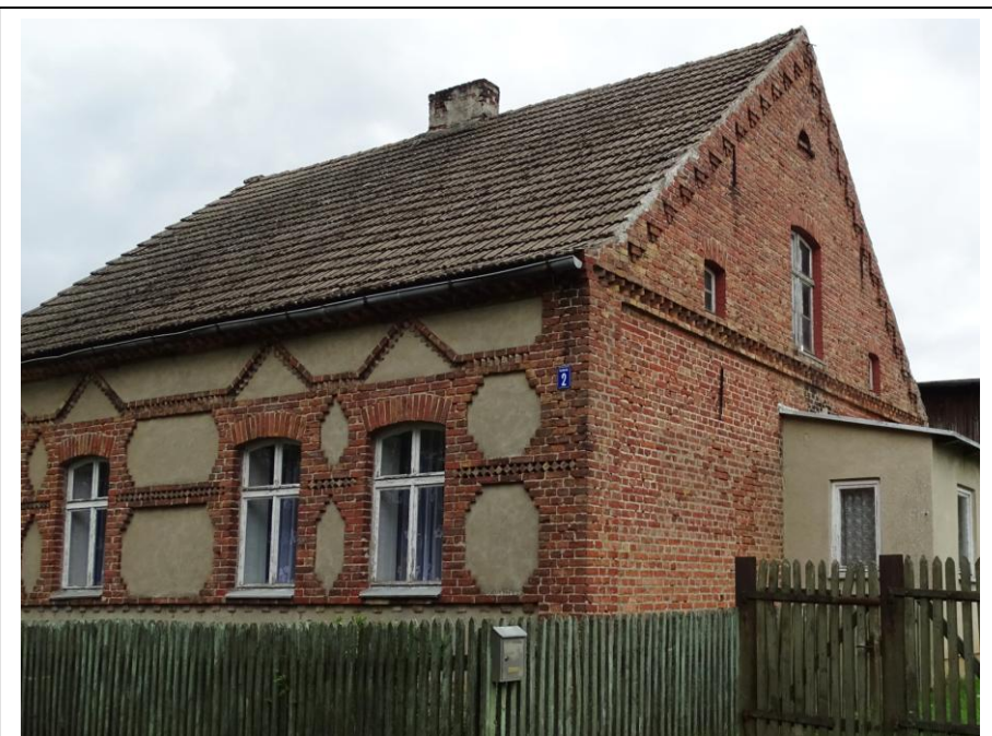
Widok ogólny od południa

Dom mieszkalny o oryginalnej formie architektonicznej i wystroju - z elementami detalu. Budynek założony na planie prostokąta (z gankiem w szczycie południowym), parterowy, nakryty dachem dwuspadowym (pokrycie dachówkowe). Ściany murowane z cegły ceramicznej, nietynkowane, za wyjątkiem części frontowej. Elewacje o rytmicznych podziałach osiowych, akcentowane ceglany detal: w obrębie fasady w formie sieci (gzymsy, opaski okienne, fryzy), gzymsy pilaste i schodkowe. Stolarka okienna drewniana, historyczna; okna dzielone krzyżem.