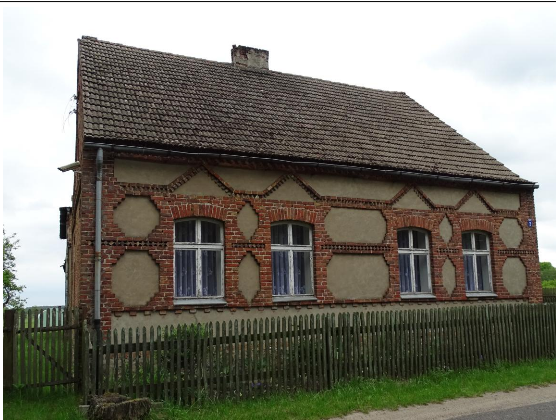
Elewacja frontowa - zachodnia

8. Fotografia z opisem wskazującym orientację albo mapa z zaznaczonym stanowiskiem archeologicznym