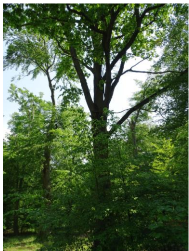
Widok od zachodu (z drogi)

Park założono prawdopodobnie na pocz. XIX w., z wykorzystaniem wcześniejszego drzewostanu leśnego, o czym świadczą najstarsze (ok. 350 letnie) dęby i buki. Założenie parkowe ma powierzchnię ok. 7,4 ha i charakteryzuje się kompozycją romantyczną. Głównymi cechami kompozycji parkowej są: aleje dębowo-bukowe i kasztanowców, owalny staw w sąsiedztwie dawnego podwórza folwarcznego, obszerne łąki parkowe, sad i ogród. Drzewa i krzewy swobodnie formowane w grupy, kępy i skupiny. W zadrzewieniu dominują: dęby, buki, wiązy i graby oraz pojedyncze lipy i klony. W parku zachowały się liczne drzewa o cechach pomnikowych – szczególnie dęby i buki.