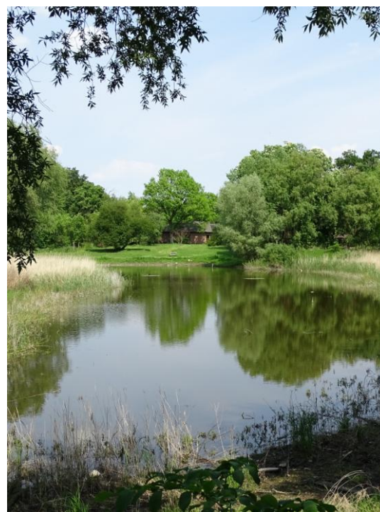
Staw w południowej części parku