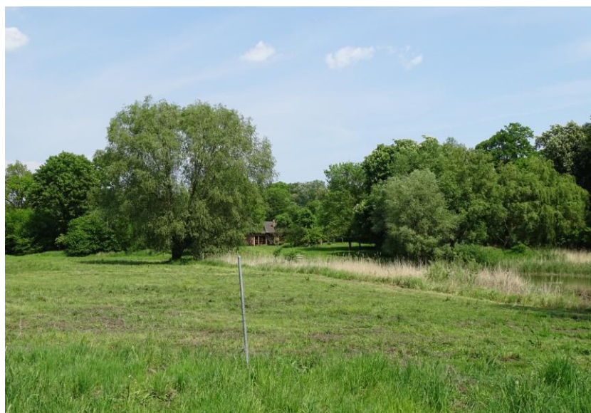
Widok ogólny od południa

8. Fotografia z opisem wskazującym orientację albo mapa z zaznaczonym stanowiskiem archeologicznym