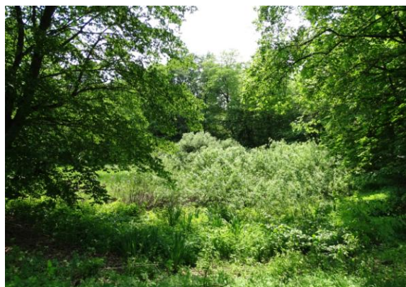
Widok ogólny od północy