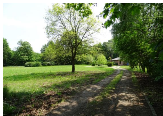
Nowy dom miejscu dworu