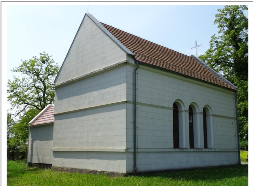
Widok od płn.-wschodu

Kościół (kaplica) wybudowany ok. poł. XIX w., po 1945 r. nieużytkowany – zrujnowany, odbudowany po 2015 r. Jest to niewielki kościół (w typie kaplicy) salowy, o prostokątnej nawie, nakryty dachem dwuspadowym, wzniesiony w stylu arkadowym Rundbogenstil . Elewacje długie akcentowane przez trzy, półkoliście zamknięte okna z opaskami. Wejście w szczycie zachodnim w formie wysokiej arkady.