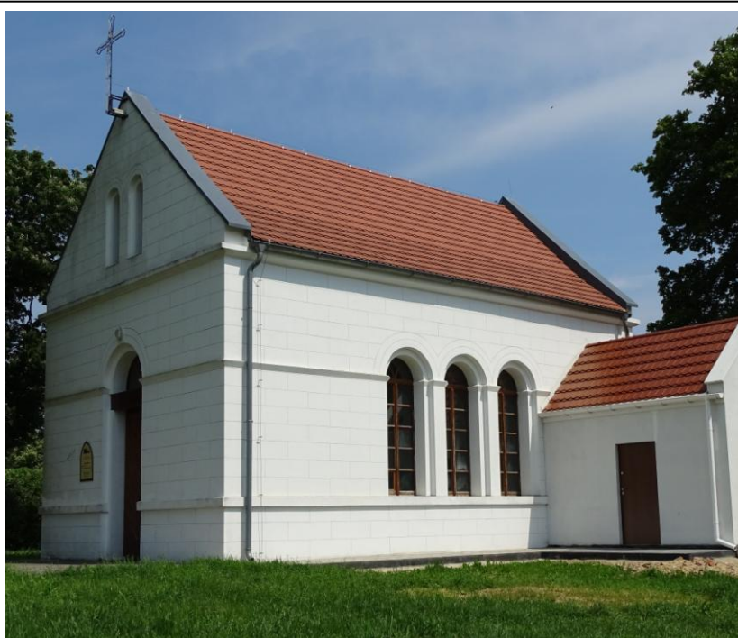
Widok ogólny od płd.-zachodu

8. Fotografia z opisem wskazującym orientację albo mapa z zaznaczonym stanowiskiem archeologicznym