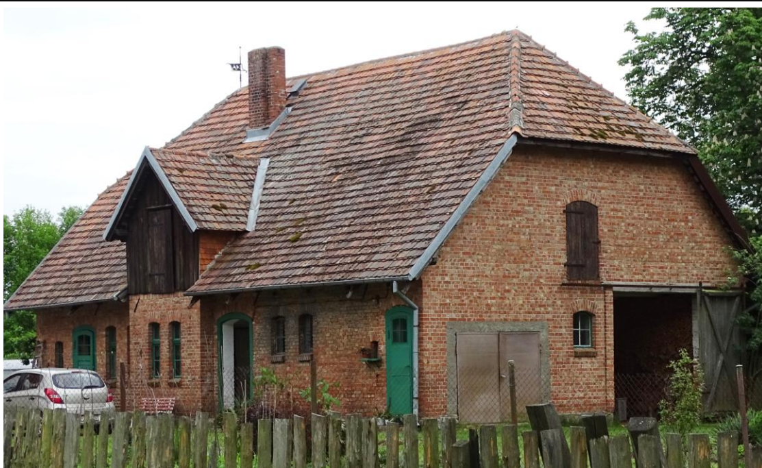
Widok ogólny od północy

8. Fotografia z opisem wskazującym orientację albo mapa z zaznaczonym stanowiskiem archeologicznym