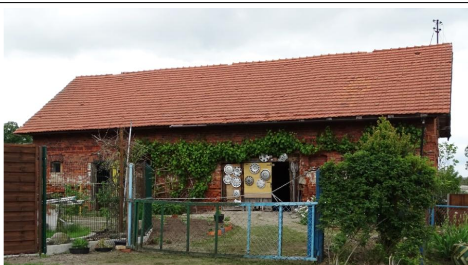
Widok ogólny od wschodu (z podwórza)

8. Fotografia z opisem wskazującym orientację albo mapa z zaznaczonym stanowiskiem archeologicznym