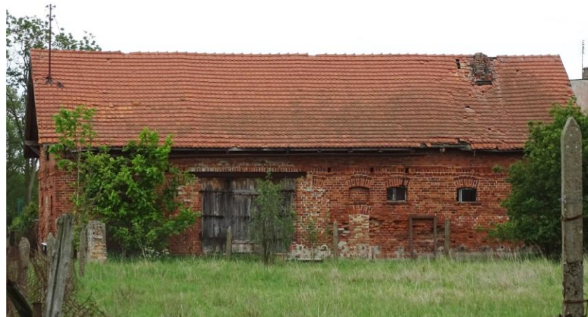
Widok ogólny od zachodu