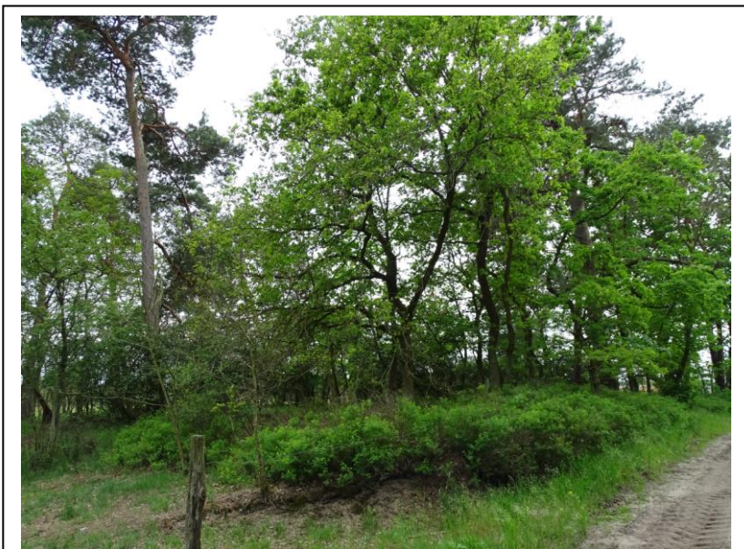
Widok ogólny od wschodu

Cmentarz położony po północnej stronie wsi, w znacznym oddaleniu od zabudowy, przy drodze polnej prowadzącej do lasu. Jest to niewielka nekropolia, o pow. ok. 0,3 ha, o regularnym (czworobocznym) układzie. Zatarty układ kwater i pochówków; zachowane pojedyncze podstawy (obudowy) nagrobków, a mogiły są rozkopane. Teren porośnięty luźnym drzewostanem (głównie sosny i akacje) oraz gęstym lilakiem.