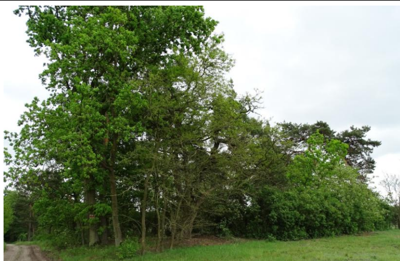
Widok ogólny od zachodu

8. Fotografia z opisem wskazującym orientację albo mapa z zaznaczonym stanowiskiem archeologicznym