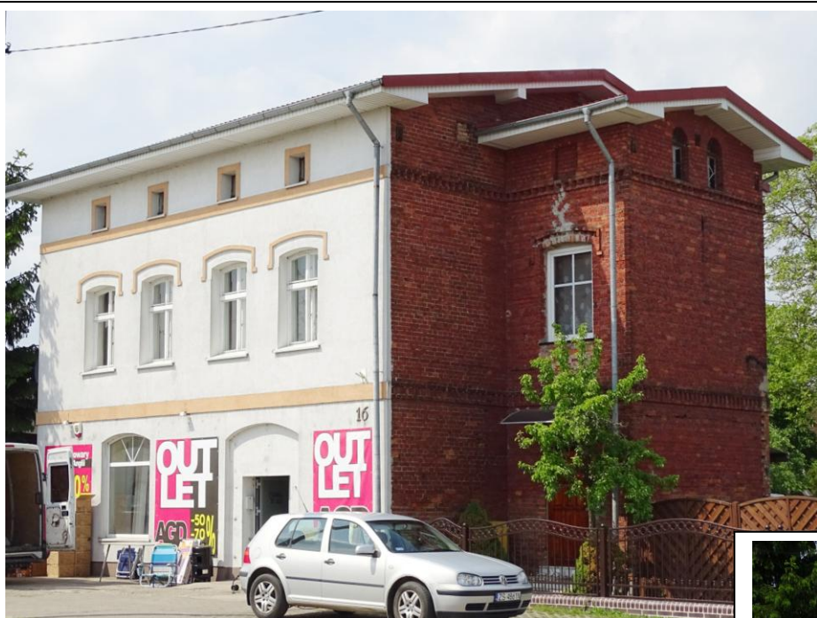
Widok ogólny od płd.-wschodu

8. Fotografia z opisem wskazującym orientację albo mapa z zaznaczonym stanowiskiem archeologicznym