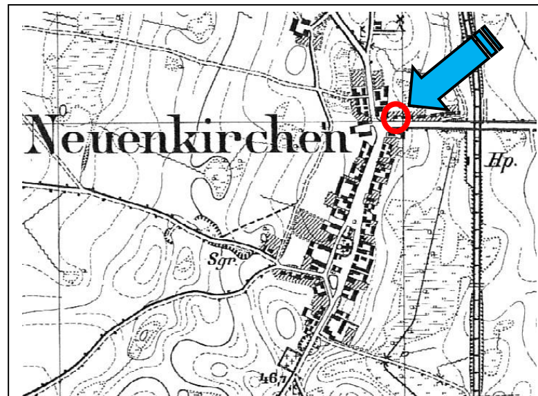
Dołuje: mapa sztabowa ( Messtischblatt ) - 1921